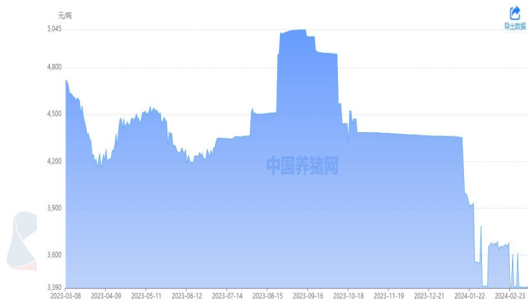
图 6: 豆粕市场价格

巴西和阿根廷这两个主要生产国的大豆收割工作已经进行得很顺利，预计供应充足。近几周来，分析师们一直在下调巴西的产量预估，但由于上个季度创下了创纪录的丰收，巴西的大豆库存仍然充裕。国内豆粕库存校服累库，饲料企业豆粕库存仍在低位，补库需求尚存，未来豆粕或将继续回升。据中国养猪网数据显示，3月8日豆粕价格为3398元/吨，较上周五上涨2元/吨。