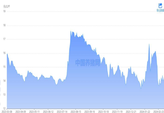
图 1：外三元生猪价格