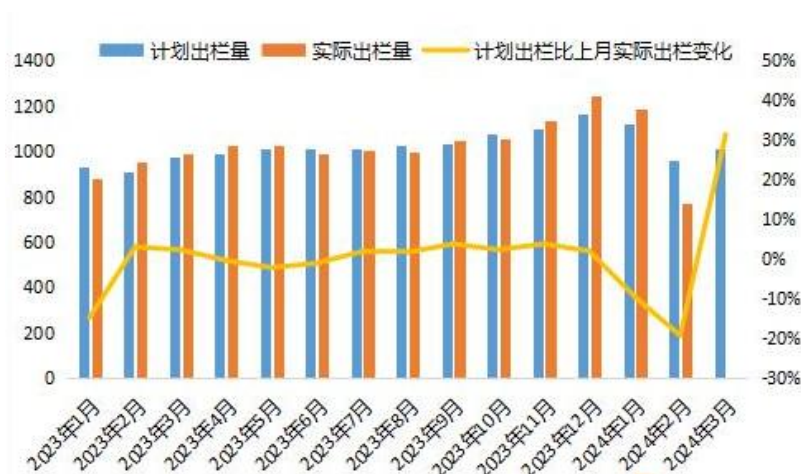
图 3：养殖企业生猪出栏量情况

2024 年 2 月生猪实际出栏量达到 770.41 万头，出栏量完成 80.17%。3 月国内养殖企业计划出栏量为 1011.96 万头，较 2 月实际出栏大增 31.35%。或许 2 月末未完成的量有一部分将在 3 月出栏，虽然 3 月出栏总量要多于 2 月，但从日均来看，2 月出栏天数仅为 21 天，日均在 36.7 万头，3 月出栏日均在 32.6 万头，可见 3 月出栏压力较 2 月缩量。