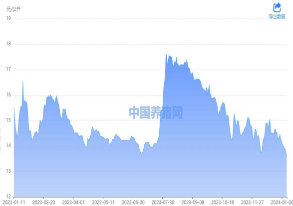
图 1：外三元生猪价格