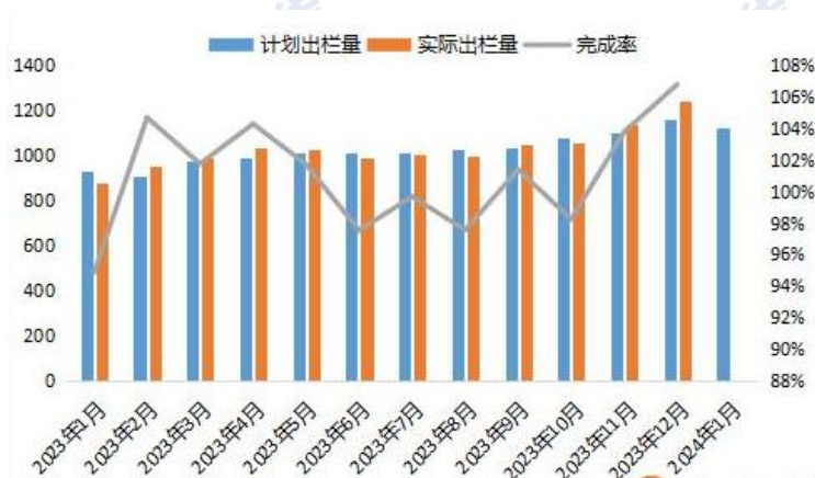
图 3：2023 年养殖企业生猪出栏量情况

12月生猪出栏量超计划6.79%完成，1月出栏计划出栏量达到1125.71万头，远超去年同期水平，较12月实际出栏锐减9.42%。根据数据推算，仔猪出栏也为市场带来压力，今年4-9月全国新生仔猪量同比增长5.9%，这些仔猪将在未来6个月内陆续出栏。生猪去产能依旧缓慢，11月能繁母猪存栏量4158万头，环比下滑52万头，但当前生猪存栏依旧高于4100万头的正常保有量。11月份，全国生猪出栏环比增长4.2%、同比增长8.9%。