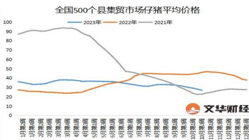
图 3：全国 500 个县集贸市场仔猪平均价格