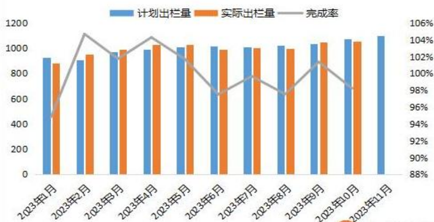
图 3：2023 年养殖企业生猪出栏量情况