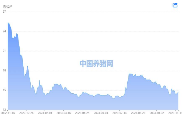
图 1：外三元生猪价格