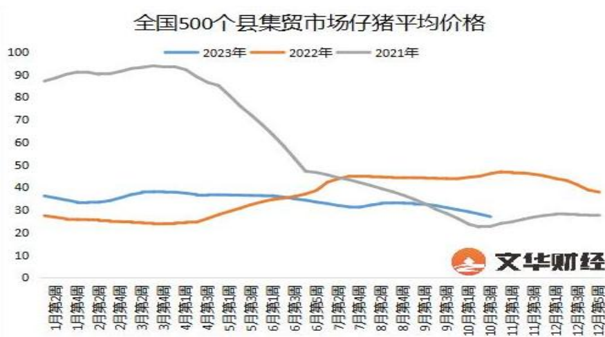
图 3：全国 500 个县集贸市场仔猪平均价格