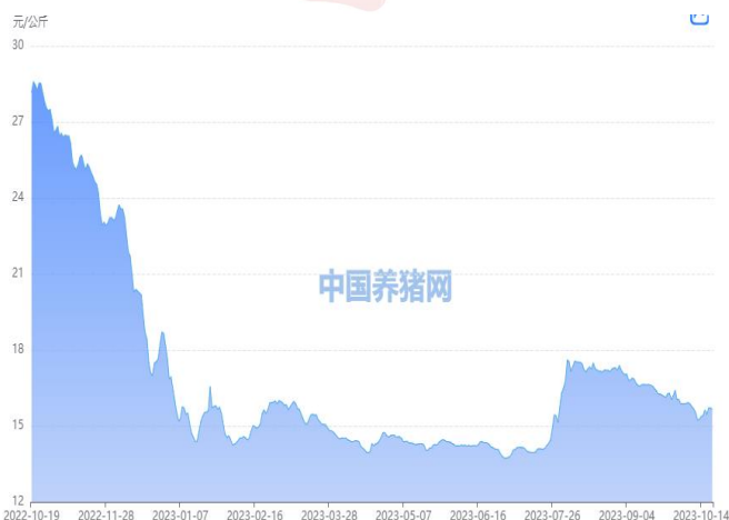
图 1：外三元生猪价格