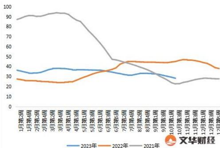
图 3：全国 500 个县集贸市场仔猪平均价格