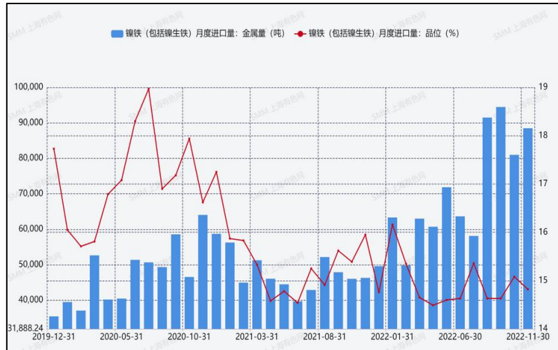
图 4：我国镍铁月度进口量