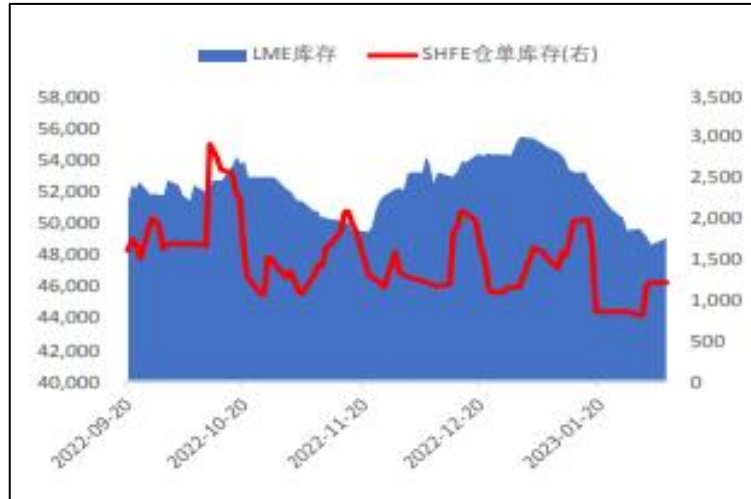
图 5: LME、上海镍库存