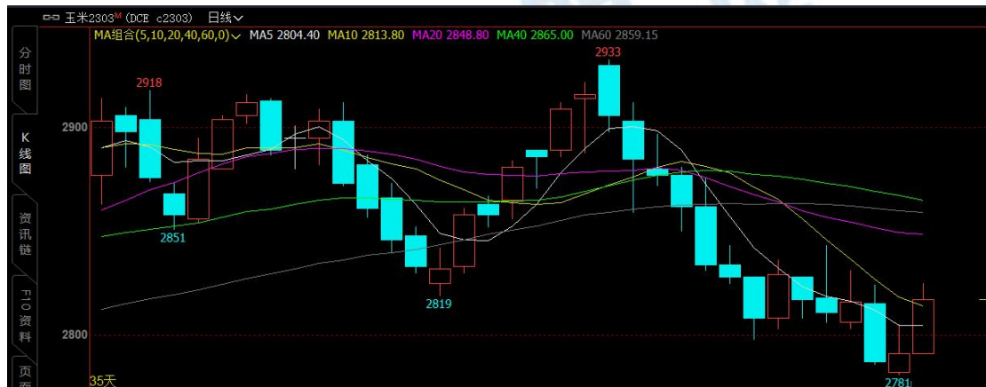
图 1

本周玉米盘面价格呈震荡走势。本周玉米主力合约 2303 最低收盘价为 2787 元/吨，最高收盘价为 2817 元/吨，周涨幅 0.00%。