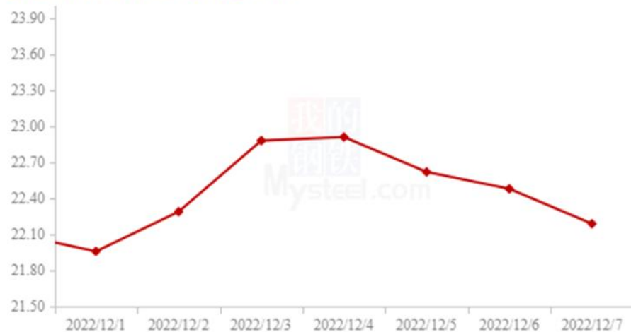
全国生猪出栏均价走势图 (元/公斤)

年末消费情况如不能达到常年均值，那价格可能出现踩踏状况，现货方面，散户解封加集团厂出栏增加导致部分地区出现踩踏，后续消费启动后或有好转但目前来看很难逆转弱勢。