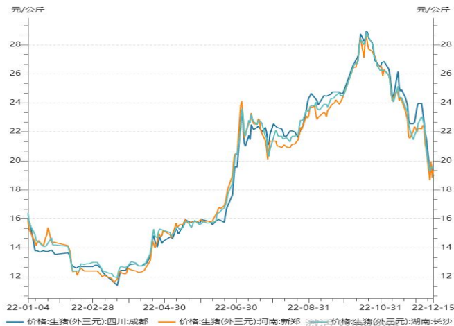
图 3：重点省市生猪价格