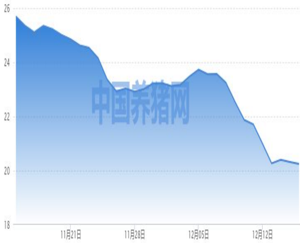
图 1：外三元生猪价格