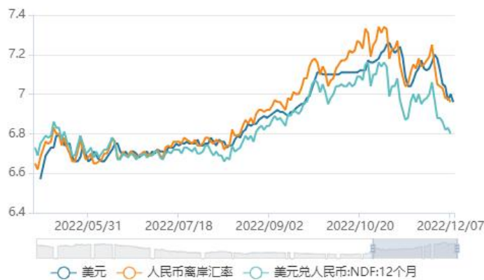
在岸与离岸人民币汇率

从资金面来看，本周北向资金继续保持净流入，周内净流入金额合计 65.50 亿元，其中沪股通净流入 43.98 亿元，深股通净流出 109.48 亿元。