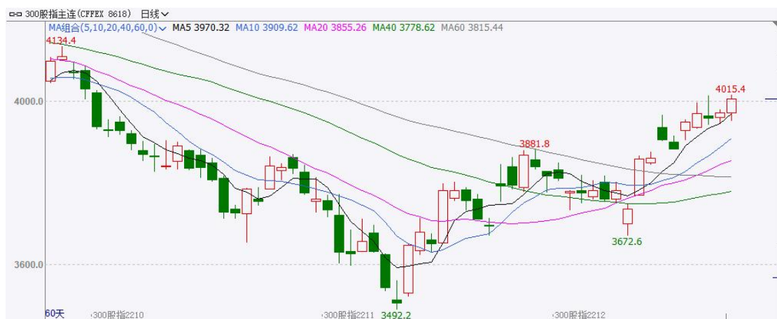
图 1 IF 期货价格

周内股指震荡上涨。具体来看，沪深 300 指数上涨 3.29%至 3998.24 点，IF 主力合约上涨 3.13%至 4005.0 点；上证 50 指数上涨 3.52%至 2706.74 点，IH 主力合约上涨 3.38%至 2708.6 点；中证 500 指数上涨 0.39%至 6192.30 点，IC 主力合约上涨 0.46%至 6204.2 点。中证 1000 指数上涨 0.00%至 6680.38 点，IM 主力合约上涨 0.32%至 6684.8 点。