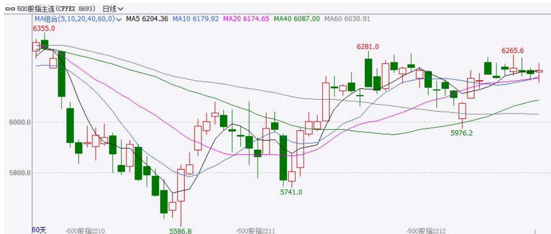
图 3 IC 期货价格