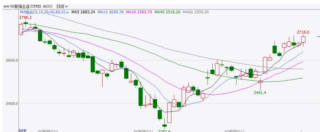
图 2 IH 期货价格