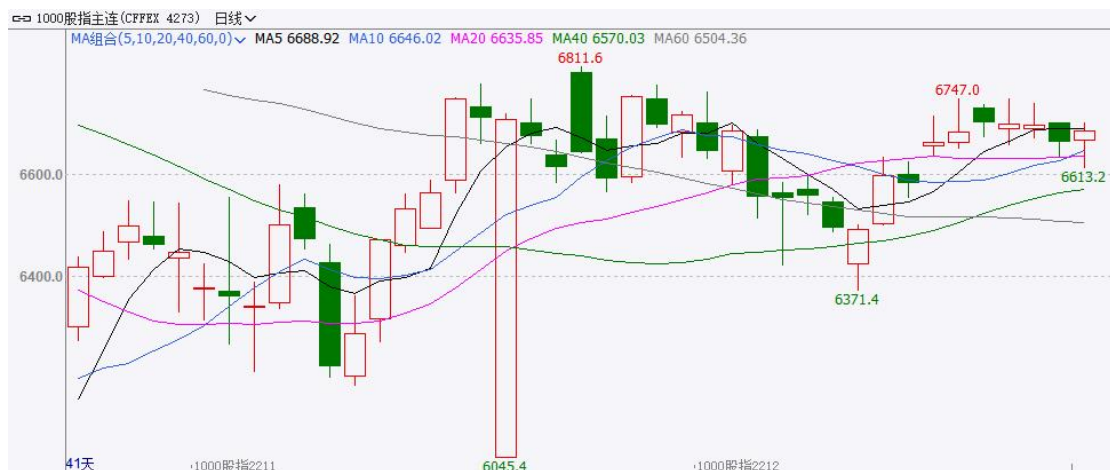
图 4 IM 期货价格