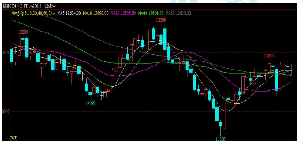
数据来源：文华财经 和合期货

本周天胶主力 RU2301 震荡运行。截止本周五收盘，主力合约收盘价 12735 元/吨，较上周五下跌 20 元/吨，周涨幅-0.16%。