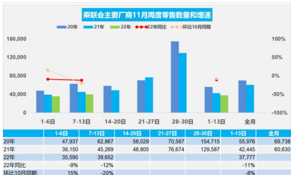
图 5：11 月乘用车周度走势