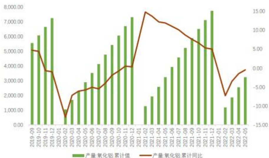
国内氧化铝产量（万吨）

6月国内氧化铝产量684万吨，净出口10万吨，总供应674万吨，总需求671万吨，过剩3万吨，整体供需由不足转为过剩。氧化铝作为电解铝重要生产原料，占总成本40%左右，氧化铝价格的下移和供应的过剩使得电解铝成本出现松动。