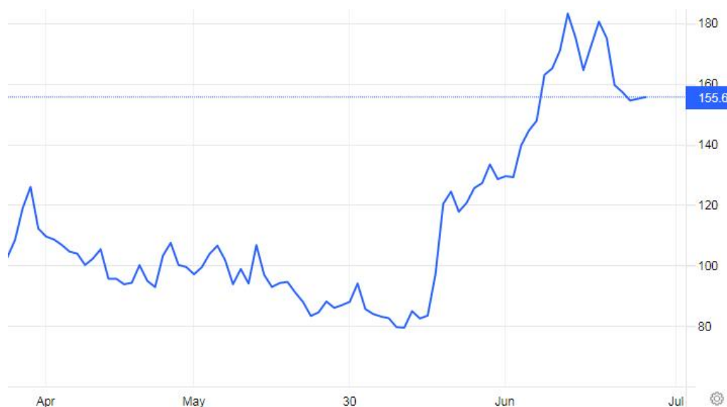
欧洲天然气价格有所回落

欧洲方面，俄罗斯向欧洲输送天然气的“北溪1号”管道按计划于周四结束年度维护工作恢复了供气，这令不少担心面临“断气”威胁的欧洲政客和民众，终于暂时长舒了一口气。本月早些时候，加拿大决定调整制裁措施，允许该北溪管道涡轮机进行修理并送回俄罗斯。德国现在正加快努力，将已经在加拿大进行维修的涡轮机送回俄罗斯，普京同时也补充称，除非涡轮机很快运回，否则下周供气量可能会下降到管道输送量的20%左右。