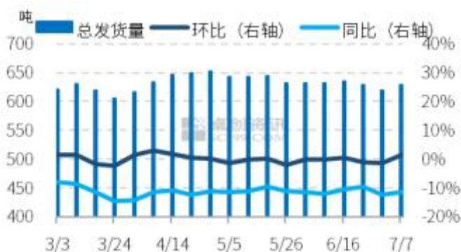
图6 全国主产区代表地区鸡蛋发货量统计图

本周主产区代表市场鸡蛋日均发货量多数增加，少数持平。周内各环节库存量不多，销区部分逢低适量补库存，产区整体走货略有好转，发货量略增。后市看，终端采购积极性或逐渐好转，市场走货渐顺畅，预计下周主产区代表市场发货量或低位缓增，幅度暂有限。