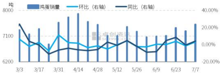
图7 全国代表城市销量统计图

本周产区蛋价触底小幅反弹，下游经销商多看好后市行情，市场走货较前期有所好转。但高温多雨天气下，鸡蛋质量问题频发，贸易商参市谨慎，随采随销在产地小批量补货。其中南方销区市场经销商由于前期维持低位库存为主，近期采购量多有增加，北方销区受湿热天气影响，市场整体销售一般。