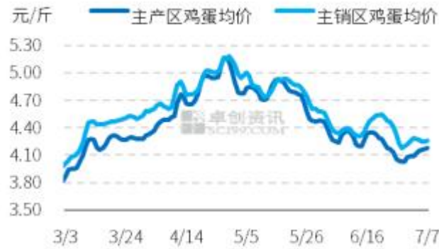
图2 全国主产区和主销区鸡蛋价格走势图