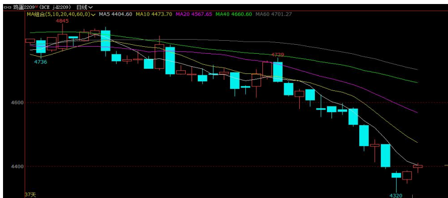
图 1 鸡蛋主力合约 2209 走势图

本周鸡蛋期货主力合约震荡下跌企稳，最低收盘价格为 4366 元/500 千克，最高价格为 4470 元/500 千克。本周现货市场行情略有好转，局部地区蛋价触底小幅反弹，下游消化有加快迹象。但期货受现货影响有限，特别是在大宗商品氛围偏空下，鸡蛋期货空头优势不减，期价持续下跌，最低跌至 4320 元/500 千克附近。周四期货底部渐显，盘面触底反弹。截止到本周五鸡蛋期货 2209 合约收于 4404 元/500 千克。