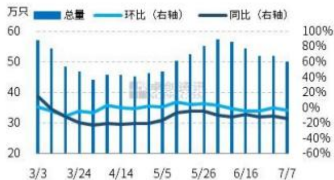
图 5 全国代表市场淘汰鸡周度出栏量统计图

本周多数产区淘汰鸡出栏量小幅减少，适龄淘汰鸡供应量有限是普遍现象，同时部分市场如山东、河北等地受降雨影响，淘鸡出栏受阻，安徽局部地区交通受限，淘鸡市场暂时休市。本周主客观原因均导致淘汰鸡出栏量减少。后期蛋价向好，养殖单位淘鸡意向或仍不高。