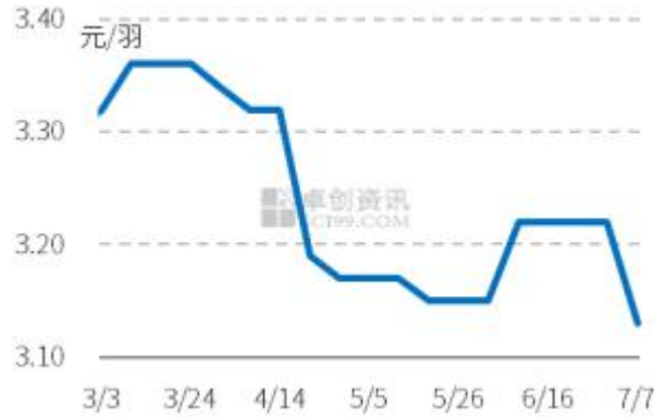
图 4 中国市场商品代蛋鸡苗周度价走势图