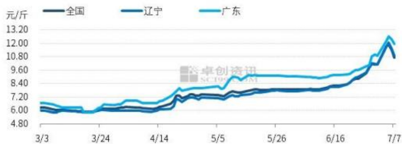
图9 全国生猪均价趋势图

本周初受养殖单位惜售抗价情绪影响，猪价呈现上涨走势，多地单日涨幅超 1.00 元/公斤，全国外三元交易均价最高涨至 23.80 元/公斤，较月初 Z 涨 17.71%。后半周受政策面调控影响，市场看涨情绪略有消退，养殖端出栏积极性有所提升，加之终端消费难以跟进，屠宰企业开工率持续走低，市场缺猪局面缓解，猪价高位回调。