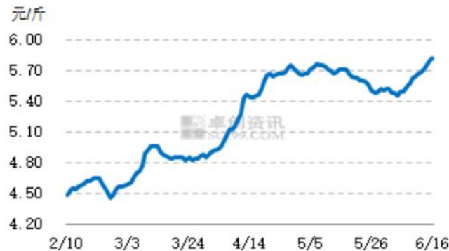
图3 全国主产区海兰褐淘汰鸡棚前均价走势图

本周全国主产区淘汰鸡价格继续小幅上涨，全国淘汰鸡周均价 5.73 元/斤，环比上涨 0.20 元/斤，涨幅 3.62%。本周鸡蛋价格触底，后期小幅上涨，养殖单位多期待后期行情，因此目前淘汰老鸡积极性较低，加之适龄老鸡偏少，导致本周淘汰鸡供应量较少。下游屠宰企业多按需开工，采购积极性一般，农贸市场销量仍不多。