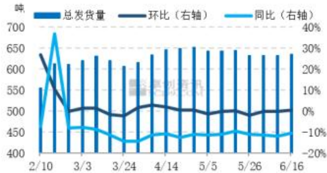
图6 全国主产区代表地区鸡蛋发货量统计图

本周主产区代表市场鸡蛋日均发货量部分稳定，部分增加。周内蛋价降至阶段性低位，终端拿货积极性略有改善，带动部分地区发货量增加，多数库存略有减少。后市看，高温高湿天气影响下，终端采购依然谨慎，各环节多顺势出货，预计下周主产区代表市场发货量或低位整理，再增有限。