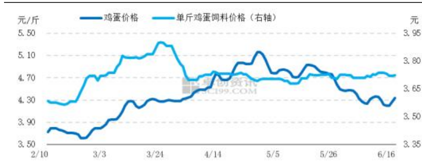
图 8 鸡蛋价格与单斤鸡蛋饲料成本走势图

本周 43%蛋白豆粕全国平均价格 4284 元/吨，环比跌幅 0.16%。豆粕价格跌幅有限，但玉米价格持续小幅上涨，饲料成本小幅提升，本周单斤鸡蛋饲料平均成本依旧为 3.73 元，环比涨幅 0.27%。