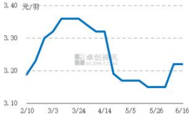
图4 中国市场商品代蛋鸡苗周度价走势图 数据来源：卓创资讯