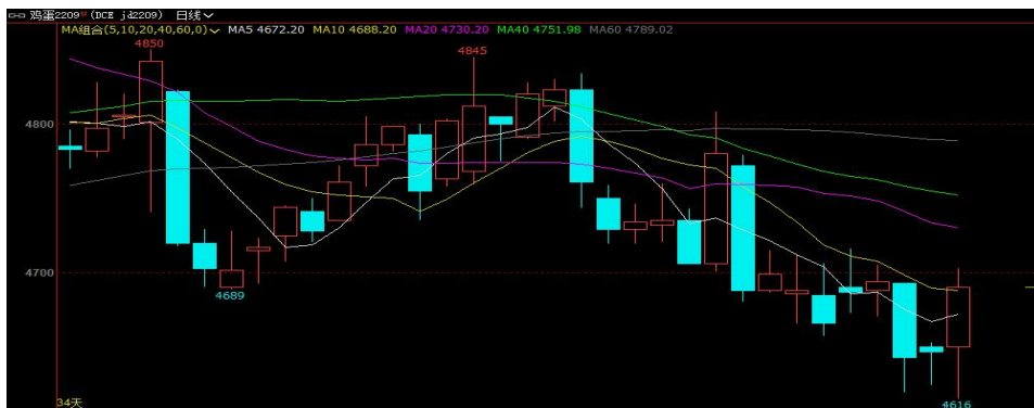
图1 鸡蛋主力合约 2209 走势图

本周鸡蛋期货主力合约 2209 行情震荡调整，最低收盘价格为 4643 元/500 千克，最高价格为 4694 元/500 千克。周初现货行情基本触底，蛋价平稳运行，期货多空僵持，盘面区间震荡调整为主，市场交投转淡，业者观望情绪浓厚。周三现货行情好转，蛋价触底反弹，但期现行情背离，空头加仓下压，盘面承压下跌，刺穿震荡区间下方，期价跌至 4620 元/500 千克附近，再跌乏力，重心再度回升，截至周五，鸡蛋期货主力 09 合约收于 4690 元/500 千克。