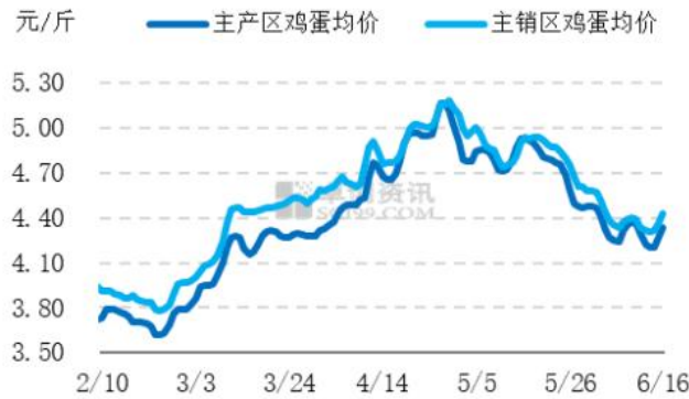
图2 全国主产区和主销区鸡蛋价格走势