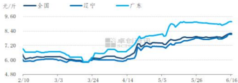
图 9 全国生猪均价趋势图

本周上海地区猪肉消费量短时增加，吸引周边省份白条外调量小增，同时产品走货速度的好转刺激山东、河北等地屠宰企业开工率短时提升。北方养殖单位走货顺畅，提价看涨的情绪不断升温，并辐射至南方，引发南、北猪价联动上涨。但随着市场对高价的逐渐排斥，周后期猪价止涨走稳。