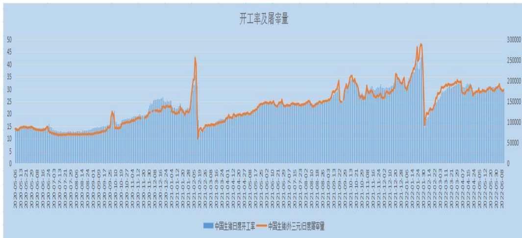
图 4 生猪屠宰及开工情况