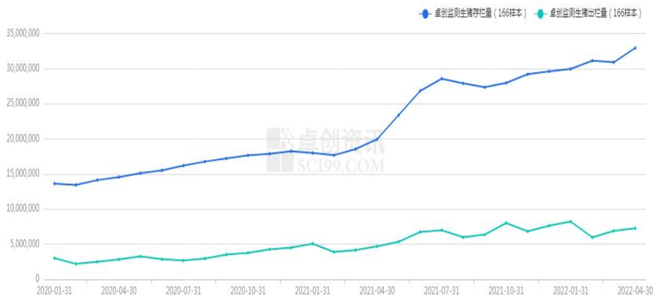
图 2 生猪存栏和出栏量

不减少的养殖户主，按初次核定数据每头存栏生猪补贴 200 元。此外，江西、河北、四川等地也释放出生猪“稳产能”的信号。比如，四川省内江市宣布，对 2022 年 6 月至 12 月新购优良种母猪原则上每头给予不低于 300 元/头优良种母猪引种补贴。各地发出“稳产能”的信号，长期来看，这是逆周期调节的一个部分，因为目前仍然处于亏损周期的后半段。其实，从去年生猪价格持续回落之后，国家和地方的政策，都是往稳产能、调周期的方向来走，关键点就在于保供，保障生猪需求，限制猪价过快上涨。