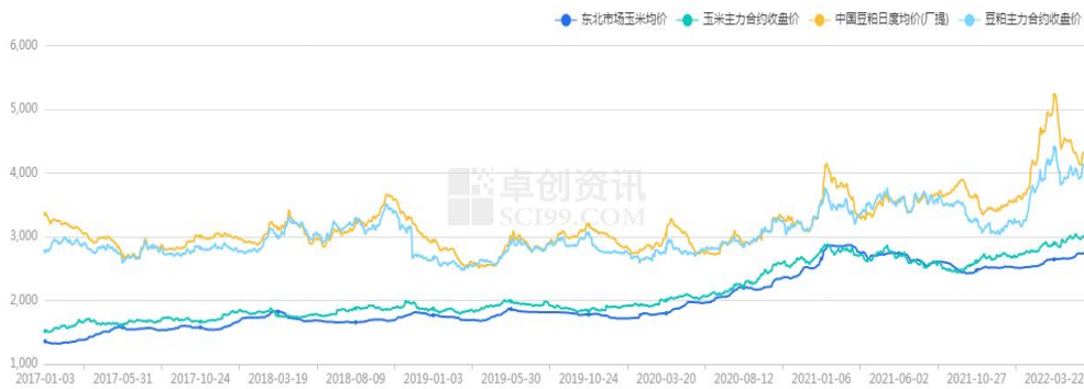
图 5 玉米和豆粕期现货价格