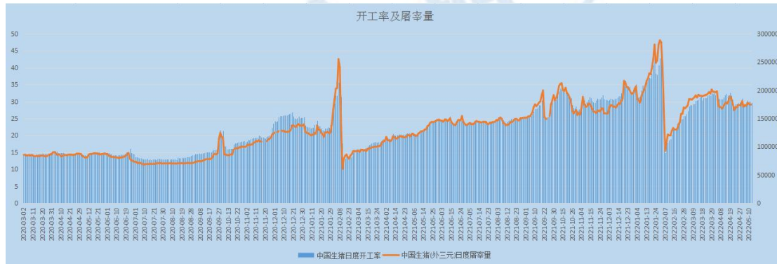
图 4 生猪屠宰及开工情况

日度屠宰量为 182835 头，较上周同期增加 8729 头，增幅 5.01%。目前整体来看，全国可监测的 31 个省/市/自治区当中，猪价呈 25 涨 1 平 5 跌的态势。北方地区以涨为主，养殖户惜售情绪较强，集团猪企生猪出栏价格上调，由于屠宰企业低价收猪有难度，屠企提价收猪现象增多，集团猪企走货表现较好，溢价较为明显，南方地区涨势凶猛。除猪价上涨外，各地的猪肉价格也开始上涨。