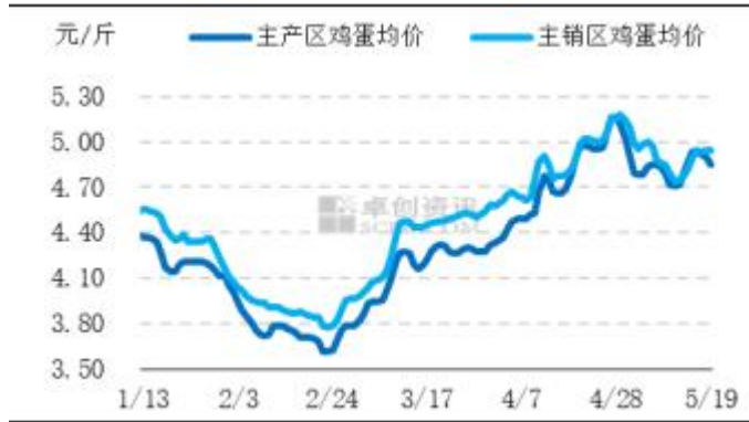
图2 全国主产区和主销区鸡蛋价格走势图