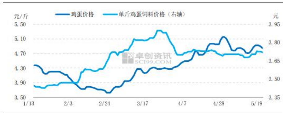
图8 鸡蛋价格与单斤鸡蛋饲料成本走势图