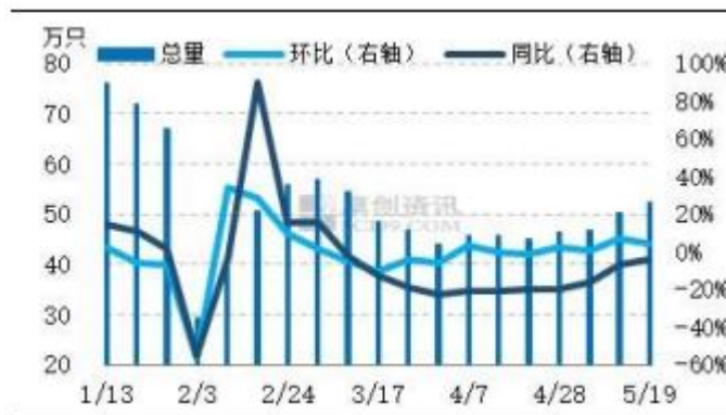
图5 全国代表市场淘汰鸡周度出栏量统计图 数据来源：卓创资讯

本周适龄老鸡仍不多，但养殖单位淘汰老鸡意向整体略有提高，部分市场即将迎来农忙，养殖单位积极淘汰老鸡，部分地区由于高温天气即将到来，养殖单位积极淘汰产蛋率不高的蛋鸡。但下游淘汰鸡需求量仍不多，不利于淘汰鸡出栏。后期养殖单位淘汰老鸡积极性再提高的空间有限，出栏量或波动不大。