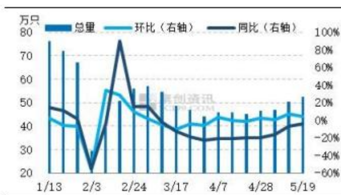
图 6 全国主产区代表地区鸡蛋发货量统计图

本周主产区代表市场日均发货量为 644.08 吨，环比增幅 0.25%，同比跌幅 9.46%。本周主产区代表市场鸡蛋日均发货量多数持平，个别略有增加。周内蛋价高位回调，终端逢低采购，部分产地走货略有好转，库存略有降低。后市看，端午效应带动下，下游陆续或有备货，预计下周主产区代表市场发货量或低位稍增。