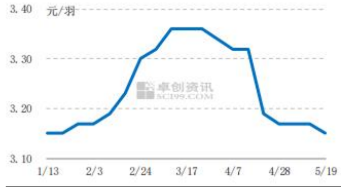
图4 中国市场商品代蛋鸡苗周度价走势图