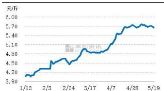
图3 全国主产区海兰褐淘汰鸡棚前均价走势图

本周全国主产区淘汰鸡价格小幅上涨后下跌，整体调价幅度仍不大，全国淘汰鸡周均价 5.69 元/斤，环比下跌 0.05 元/斤，跌幅 0.87%。本周产区待淘老鸡仍不多，前期养殖单位淘汰意向一般，低价收鸡略难，因此价格微涨；后期受蛋价偏弱影响，淘汰老鸡积极性提高，价格小幅下调。目前由于淘汰鸡仍不多，下跌空间不大，下游屠宰企业产品消化一般，开工率不高，个别中小厂仍停工，农贸市场消化速度平平。与周初相比，西南地区跌幅最大，周初均价 5.98 元/斤，周内跌幅 3.23%。