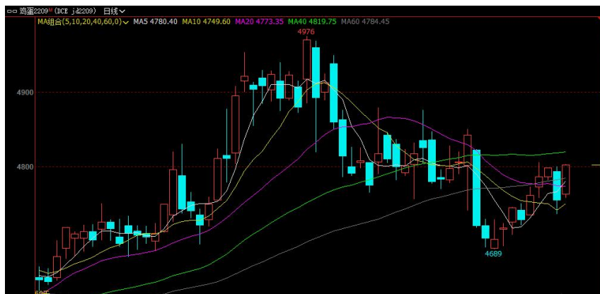
图 1 鸡蛋主力合约 2209 走势图

本周鸡蛋期货主力合约 2209 行情先涨后反弹，最低收盘价格为 4755 元/500 千克，最高价格为 4802 元/500 千克。上周末现货蛋价延续涨势，基本面氛围依旧偏强。周一期货受现货拉动，开盘增仓上涨，盘面冲破前期顶部压力位 4760 元/500 千克一线，但随后重心回落至 4740 元/500 千克附近，盘面短暂震荡后继续拉升。周二多头优势不减，开盘期价稳步上涨，期价短暂冲破 4800 元/500 千克一线。但重心再涨动力不足，加上现货蛋价出现回落，加重期货顶部压力，盘面在 4790 元/500 千克一线震荡后回落。周五期价反弹再次冲破 4800 元/500kg 一线，报收 4802 元/500kg。