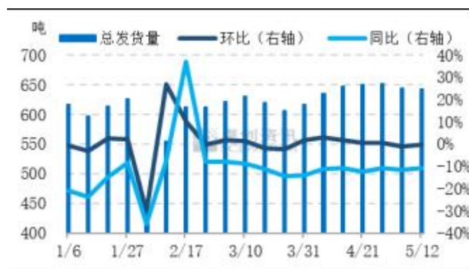
图 6 全国主产区代表地区鸡蛋发货量统计图

全国主产区代表市场发货量变化不大。本周主产区代表市场日均发货量为 642.50 吨，环比跌幅 0.19%，同比跌幅 11.00%。本周主产区代表市场鸡蛋日均发货量变化不大，多数持平，少数随行微调。周内蛋价涨至高位，终端采购谨慎，产地内销为主，外销多有减少。后市看，下游采购或仍较谨慎，各环节顺势出货，预计下周主产区代表市场发货量 或低位整理。