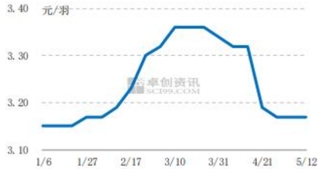
图4 中国市场商品代蛋鸡苗周度价走势图