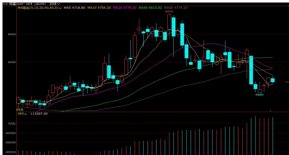
图 1 鸡蛋主力合约 2209 走势图

本周鸡蛋期货主力合约 2209 行情触底小涨,最低收盘价格为 4702 元/500 千克,最高价格为 4744 元/500 千克。五一假期过后,终端补货走货好转,蛋价小幅上涨。期货受现货影响,5 日开盘下探后,重心反弹拉升,期价最高涨至 4850 元/500 千克附近。6 日现货涨价乏力,期货开盘后持续下跌,空头优势明显,重心刺穿 4800 元 /500 千克一线,特别是尾盘期价跌至 4700 元/500 千克附近。之后现货行情转弱,但整体库存压力不大,制约蛋价下跌幅度。期货多空僵持,底部 4700 元/500 千克支撑强劲。12 日期货交投氛围好转,多头优势加强,盘面触底小幅上涨。截止到本周五鸡蛋期货 2209 合约收于 4728 元 /500 千克。