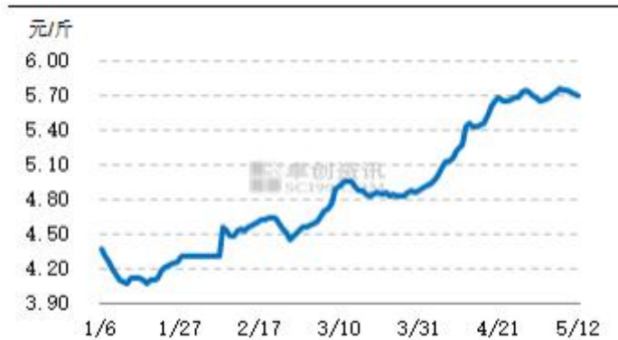
图3 全国主产区海兰褐淘汰鸡棚前均价走势图

本周全国主产区淘汰鸡价格小幅上涨后回落，整体调价幅度不大，全国淘汰鸡周均价 5.74 元/斤，环比上涨 0.05 元/斤，涨幅 0.88%。五一节期间受蛋价下跌影响，养殖单位淘汰老鸡积极性略提高，淘汰鸡价格微幅下跌。本周蛋价再跌趋势不明显，因此养殖单位压栏惜售心理渐起，淘汰鸡供应量普遍不多。下游屠宰场开工率仍不高，略抵触高价货源，农贸市场销量略有恢复，但仍处于低水平。