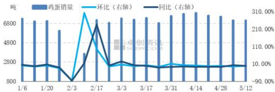
图7 全国代表城市销量统计图 数据来源：卓创资讯 和合期货

端午节将至，商超、电商平台或提前储备货源，贸易商在产地拿货量或增，市场走货速度有望转好，特别是产地内销。