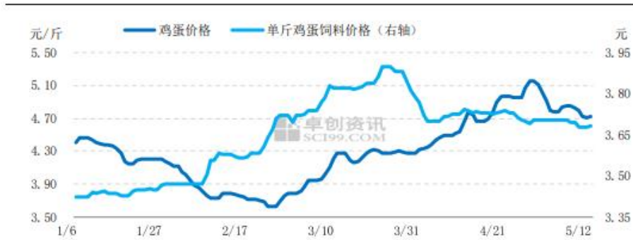
图 8 鸡蛋价格与单斤鸡蛋饲料成本走势图

本周 43%蛋白豆粕全国平均价格 4154 元/吨，价格节前（4 月 22-28 日）跌幅 4.26%。玉米价格继续走高，但豆粕价格下调，且豆粕价格跌幅 远大于玉米 价格涨幅，饲料成本继续回调，本周单斤鸡蛋饲料平均成本为 3.69 元，环比跌幅 0.27%。