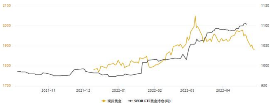
SPDR ETF 黄金持仓 (吨)

据世界黄金协会数据显示，3月，在黄金ETF强势流入的驱动下，2022年一季度黄金需求比2021年同期高出34%。2022年一季度美元金价上涨8%，黄金需求(不含场外交易)同比增长34%至1,234吨；这是自2018年第四季度以来的最高水平，比其五年平均水平1,039吨高出19%。