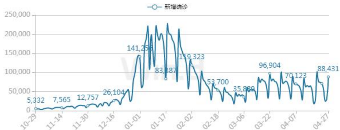
意大利每日新增确诊人数

4 月 27 日，意大利卫生部公布的最新统计数据显示，过去 24 小时内，该国新增新冠肺炎确诊病例 87940 例，累计确诊 16279754 例；新增死亡病例 186 例，累计死亡 163113 例；新增治愈病例 88545 例，累计治愈 14881965 例；现存确诊病例 1234676 例。