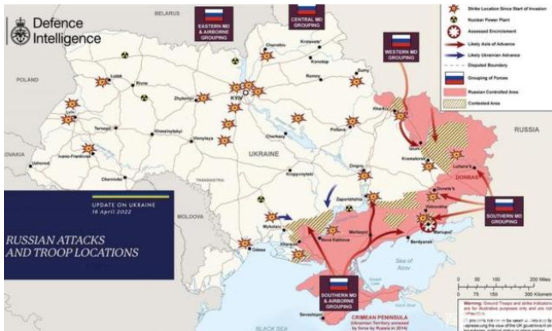
数据来源：新浪新闻

俄罗斯天然气工业股份公司 27 日发表声明, 宣布自当日起暂停向保加利亚和波兰供应天然气。声明说, 截至 26 日, 该公司未收到保加利亚及波兰两国的天然气公司用卢布支付的 4 月份天然气货款。俄总统普京 3 月 31 日签署与“不友好”国家和地区以卢布进行天然气贸易结算的总统令, 新规 4 月 1 日起生效, 俄方已及时将这一决定告知合同方。