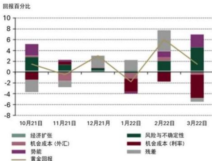
各项因素对金价的影响

券市场明显疲软的情况下，黄金是表现最好的资产之一；在充满经济不确定性且金融市场波动加剧的非常时期，黄金已被证明是风险分散和财富保值的可靠资产。