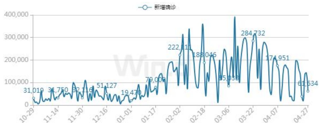
德国每日新增确诊人数

例；累计死亡病例 134832 例，较前一日新增 343 例，全国 7 天内每 10 万人发病率为 887.6。