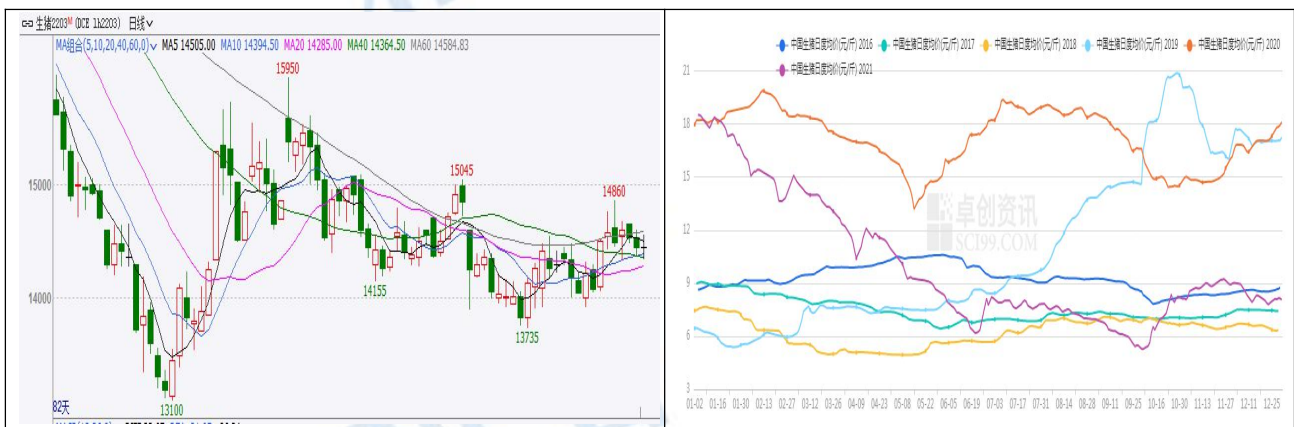
图 1 生猪期货及现货价格

生猪期价本周震荡偏弱，整体较上周小幅回落。截止周五收盘，主力 LH2203 合约收盘价 14450 元/吨，较上周五下跌 130 元/吨，跌幅 0.89%。而现货价格有所回升，截止本周五，全国生猪外三元现货均价 16.14 元/公斤，较上周上涨 0.34 元/公斤，涨幅 2.15%。