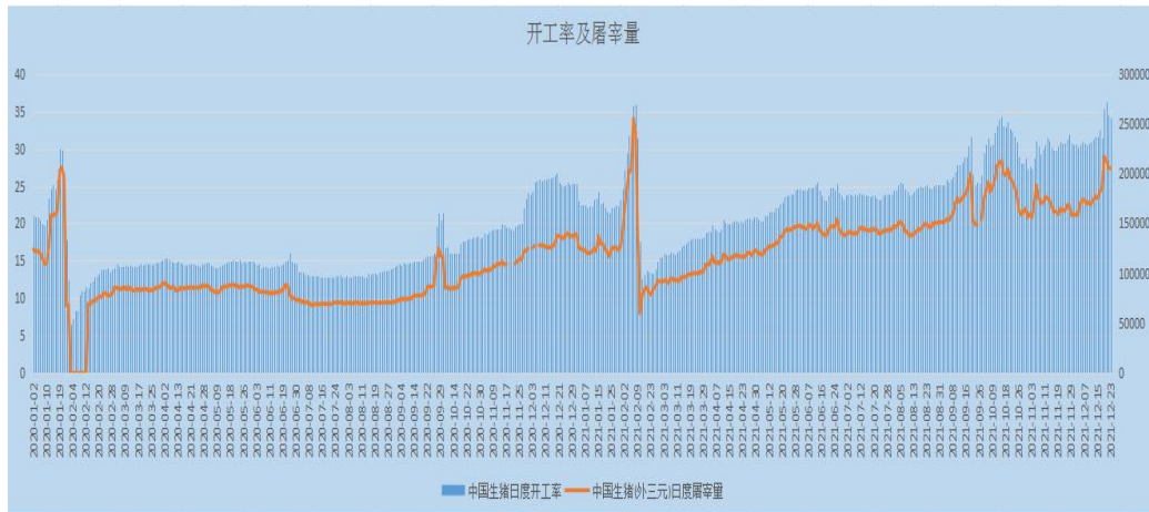
图 3 生猪屠宰及开工情况