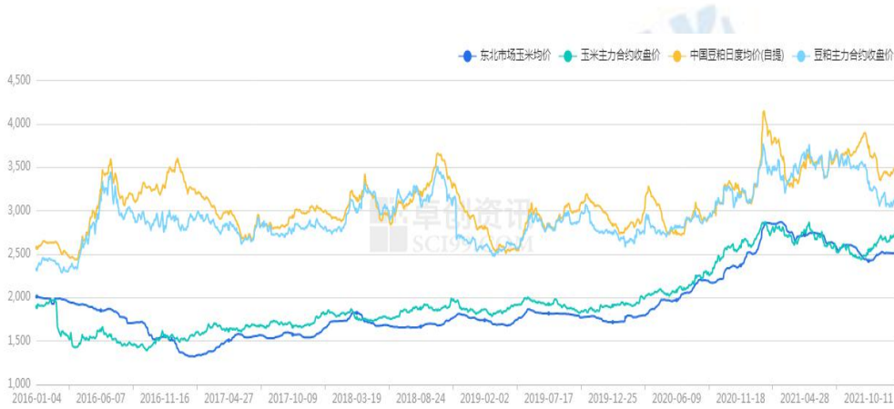
图 4 玉米和豆粕期现货价格