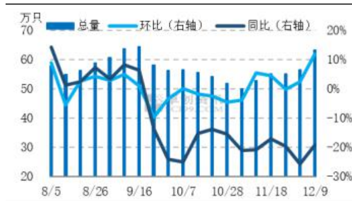
图4 全国代表市场淘汰鸡周度出栏量统计图

由于季节性流感影响，有集中淘汰现象。预计后期养殖单位淘鸡意向一般，出栏量难大增。