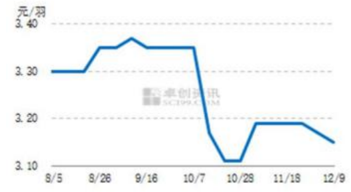
图3 中国市场蛋鸡苗周度价走势图

本周商品代鸡苗大致走稳，个别下跌，均价为 3.15 元/羽，环比跌幅 0.63%，主流报价 3.00-3.30 元/羽，少数高价 3.50-4.00 元/羽，部分低价 2.50-2.80 元/羽。目前养殖单位整体补栏积极性依旧不高，部分养殖单位逢低少量补青年鸡，对鸡苗的直接需求欠佳。部分企业鸡苗订单排至 2022 年 1 月中旬前后，部分企业随订随孵，种鸡企业种蛋利用率部分在 50%-80%，个别高，部分在 30% 左右。