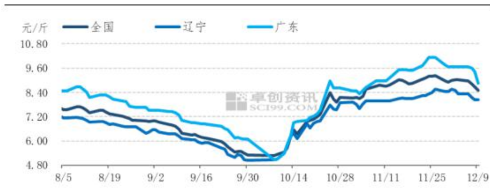
图9 全国生猪均价趋势图

本周国内生猪价格以降为主。周内外三元出栏均价 8.79 元/斤，较上周降幅 2.66%。从供应端来看，本周养殖单位抗价情绪松动，散户出栏积极性有所提升，同时部分集团猪场年末冲量，生猪整体走货量增加。从消费端来看，南方腌腊不温不火，肥猪需求量略有回落，高价白条走货迟缓，屠企走货压力渐增，压价意向浓重，周内猪价高位回调。