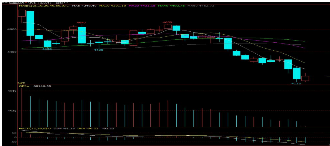
图1 鸡蛋主力合约 2201 走势图

本周鸡蛋期货主力合约 2201 行情持续下跌，最低收盘价格为 4159 元/500 千克，最高价格为 4338 元/500 千克。现货市场供需继续僵持，终端需求恢复缓慢，各环节库存压力不大，局部地区蛋价小幅上涨，但整体幅度有限。现货基本面对期货利好有限，空头优势明显，盘面继续加仓下挫，期价先后跌破 4300 元/500 千克和 4200 元/500 千克支撑位。截止到本周五鸡蛋期货 2201 合约收于 4186 元/500 千克。