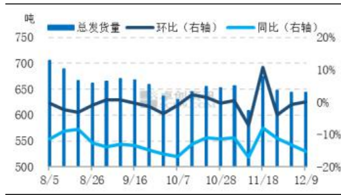
图6 全国主产区代表地区鸡蛋发货量统计图