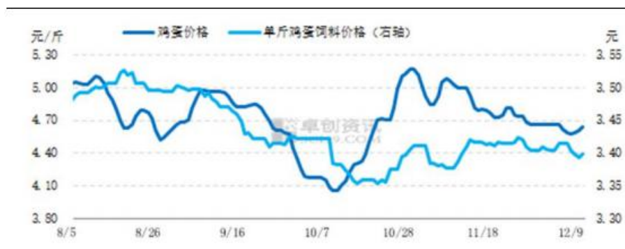
图8 鸡蛋价格与单斤鸡蛋饲料成本走势图 数据来源：卓创资讯 和合期货

本周全国玉米价格整体趋弱，东北部分地区报价坚挺。华北地区天气晴好，气温升高，下游企业玉米到货量增加，价格下滑。南方地区按需采购为主，玉米到货量尚可，价格弱势运行，其中南方港口下滑明显。本周全国玉米周度均价 2639.65 元/吨，环比跌幅 0.47%。本周内豆粕现货价格小幅上涨，期货价格偏强震荡。美豆期货震荡走高，中国买家持续对美豆进行采购，需求端为美豆期货提供支撑。国内市场受外盘提振明显，由于大豆到港延期影响，部分工厂停机，对现货价格同样形成提振。本周 43%蛋白豆粕全国平均价格 3422 元/吨，环比涨幅为 0.82%。玉米、豆粕价格调整幅度均有限，饲料成本暂无调整，单斤鸡蛋饲料平均成本维持在 3.41 元，较上周持稳。