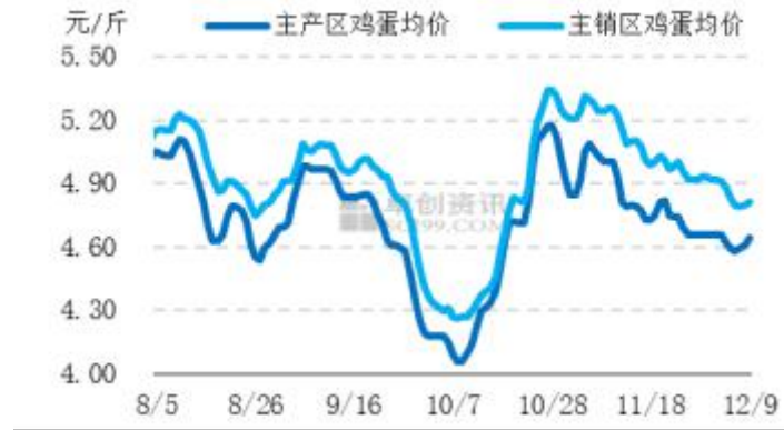
图2 全国主产区鸡蛋价格走势走势图