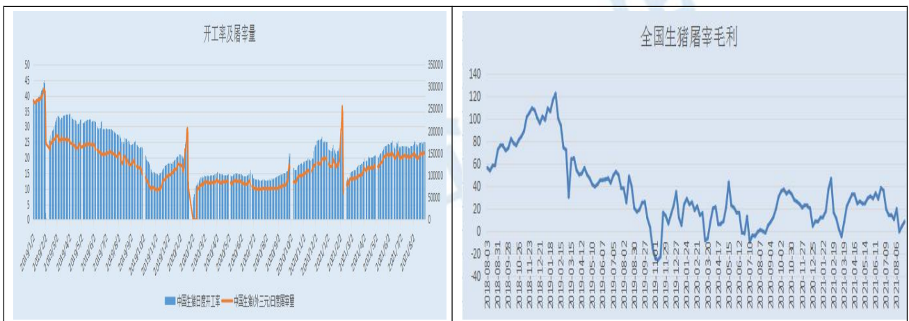
图4 生猪屠宰及开工情况

从全国生猪屠宰开工率来看，截止8月31日，全国生猪屠宰日度开工率为25.11%，较7月底提高1.15%。日度屠宰量为151272头，较7月底增加6498头，增幅4.49%。但屠宰毛利较7月份下跌，屠宰企业冻品库存高位，冻肉待机出库，市场利空因素仍在。截止8月27日，全国生猪屠宰毛利为7.9元/头，较7月底下跌2.4元/头，跌幅23.3%。