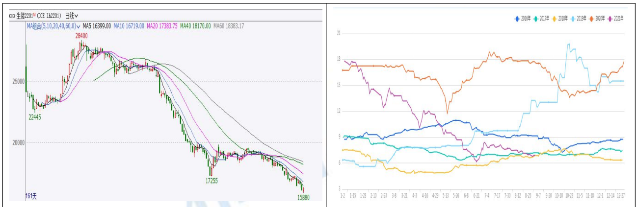
图 1 生猪期货及现货价格

继 6、7 月份连续两个月的低位震荡盘整之后，8 月份生猪期货价格更是一路下行，跌跌不休，创出上市以来最低位。截止 8 月 31 日，生猪期货主力合约 LH2201 收盘价 16760 元/吨，较 7 月底下跌 2310 元/吨，跌幅 12.11%。现货价格也是一路走低。截止 8 月 31 日，全国外三元生猪现货均价为 13.92 元/公斤，较 7 月底下跌 1.7 元/公斤，跌幅 10.88%。