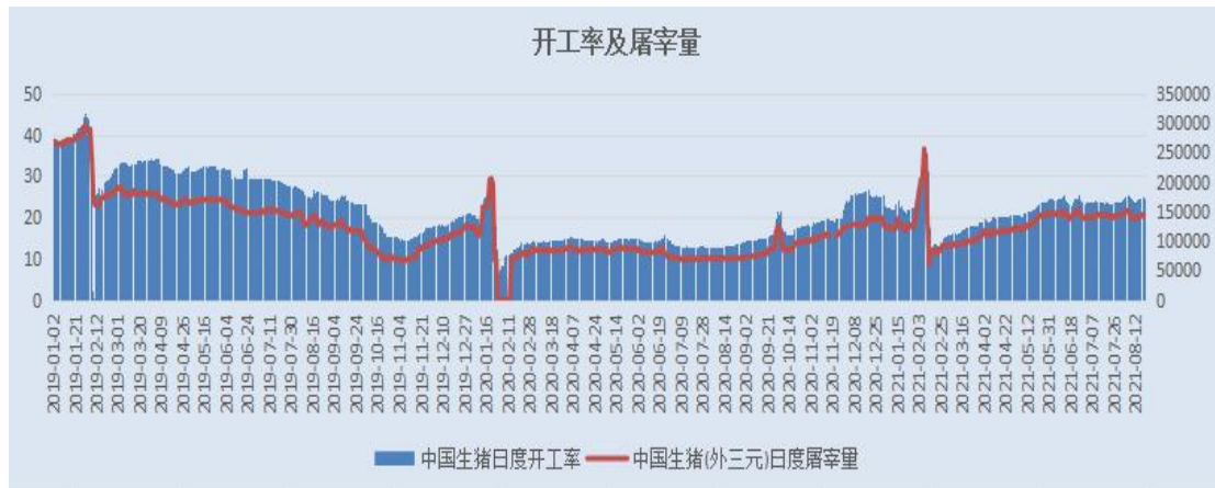
图 3 生猪屠宰及开工情况