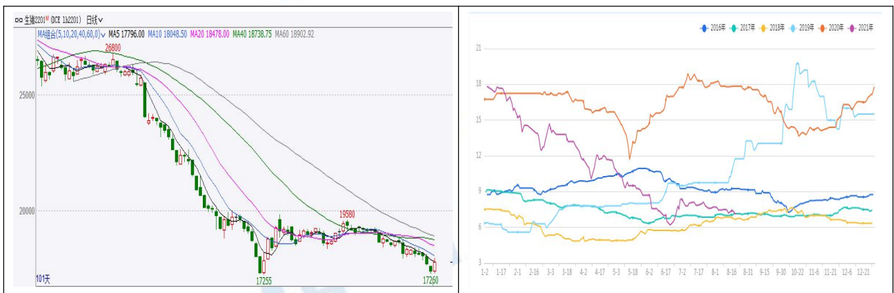
图 1 生猪期货及现货价格

本周生猪期价连跌四日后周五小幅放量反弹，周线整体继续震荡下行。截止本周五，主力 LH2201 合约收盘价 17775 元/吨，较上周五下跌 365 元/吨，跌幅 2.01%。现货市场则是先涨后跌，但整体较上周也仍呈小幅下行趋势，截止本周五，全国生猪外三元现货均价 14.6 元/公斤，较上周五下跌 0.16 元/公斤，跌幅 1.08%。