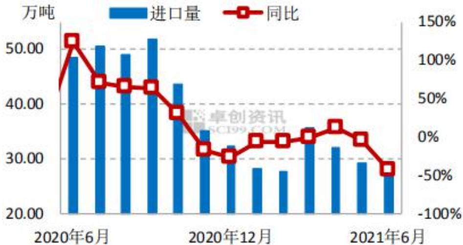
精铜进口量走势图

据中国海关总署公布的数据显示，2021年6月中国精炼铜进口量约为27.73万吨，环比减少4.84%左右，连续第三个月下滑，同比下滑42.91%。主要是铜价处于较高价格水平导致2021年6月中国废铜进口量约为15万吨，环比增加7.57%左右，恢复上涨，主要是国内政策变化，以及国内回收量不高。