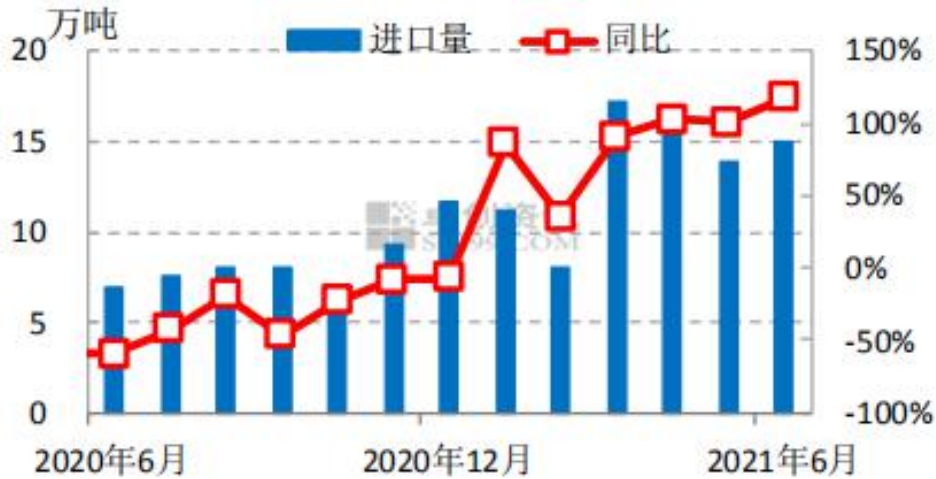
废铜进口量走势图