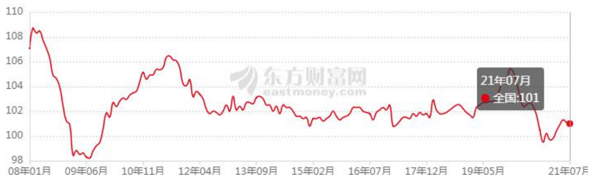
中国7月居民消费价格（CPI）同比增长

中国7月居民消费价格(CPI)同比增长1%，预期增长0.8%，前值增长1.1%，中国7月工业生产者出厂价格(PPI)同比上涨9%，预估为8.8%，前值为8.8%。国家统计局城市司高级统计师董莉娟解读2021年7月份CPI和PPI数据，7月份，各地区各部门统筹做好疫情防控、防汛救灾和经济社会发展工作，积极落实保供稳价政策，市场供需总体平稳。