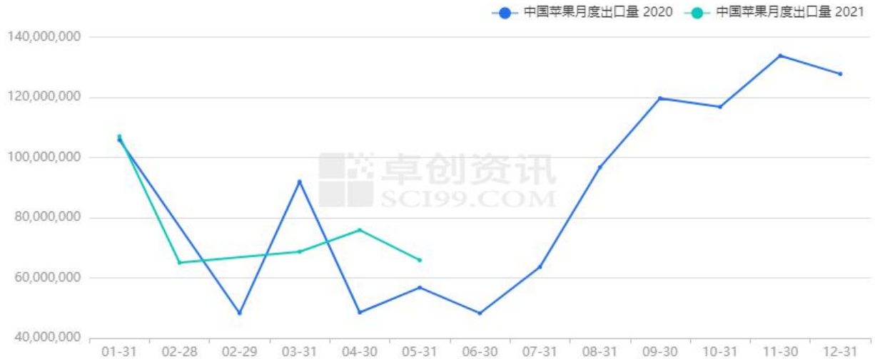
图6 中国苹果月度出口量