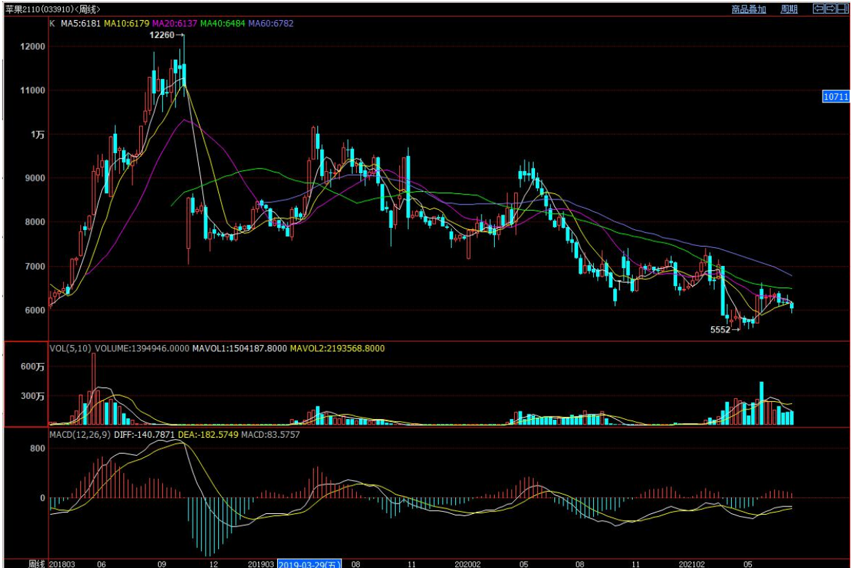
图1 苹果主力合约2109走势图

本周苹果主力合约 2110 周一至周五先下跌后震荡；本周五苹果主力合约AP2110收盘价 6047元/吨；较上周五收盘价下跌113元/吨，跌幅为1.83%。