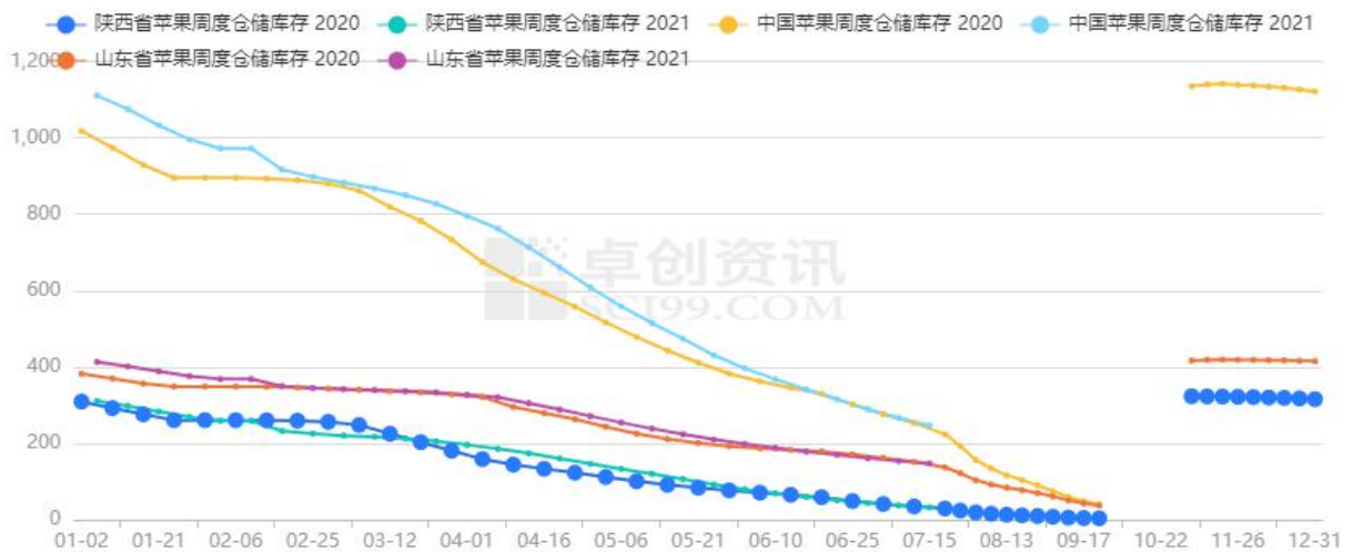
3 全国苹果库存（万吨）

据卓创资讯数据显示，截至7月15日，全国苹果库存为246.78万吨，高于去年同期的223.82万吨，分地区来看，山东地区库存为147.34万吨，略高于去年同期137.07万吨，陕西地区库存为32.36万吨，高于去年同期29.24万吨。库存消耗情况来看，7月15日当周全国苹果库存消耗量为19.91万吨，环比略有减少，分地区来看，山东地区库存消耗量为6.49万吨，陕西地区库存消耗量为5.03万吨。