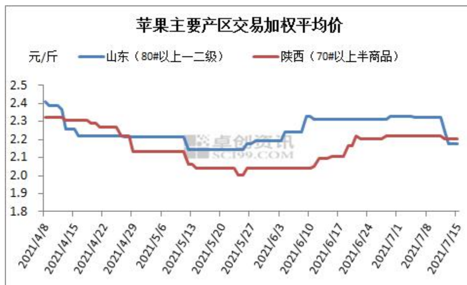
图2 苹果主要产区交易加权平均价

销区：本周（20210709-0715）批发市场苹果价格变动不大，但是出货速度明显下滑。本周我国多数地区出现高温天气，尤其是南方地区，高温天气频发。高温之下，西瓜等消暑水果销售量增加较多，不少地区市场出现抢货情况。但是苹果等水果销售量明显下降。华北等地区市场虽然降雨比较多，但是从客商反馈情况来看，市场依然高温不断，苹果销售情况不佳。市场主要销售客商自存货，以稳价销售为主。商超方面货速度与之前相比也略有不及。电商平台今年销售量不如往年同期，采购积极性一般。与之前一段时间相比，销量基本维持稳定。