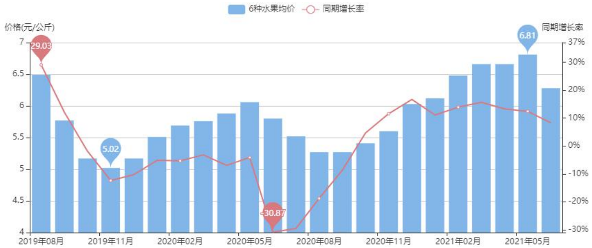
图4 6种重点水果均价