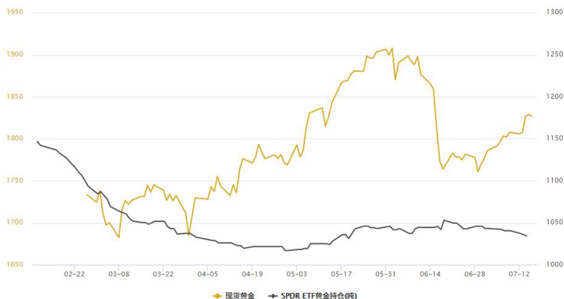
SPDR ETF 黄金持仓与黄金走势对比

自新冠爆发以来，各国央行和政府推出一系列经济刺激措施，帮助金价在 2020 年创下历史新高，但疫苗推出和经济重新开放削弱了对黄金的避险需求，黄金在 6 月份创出 2016 年以来表现最糟糕的一个月份，近期一直处于价格修复之中。