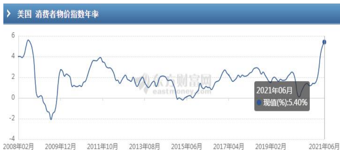
美国 6 月 CPI

分析美国 6 月 CPI 数据称，6 月季调后 CPI 月率上涨 0.9%，未季调 CPI 年率录得 5.4%，其中二手车占 CPI 增幅的三分之一，CPI 数据涨幅超过预期，因与经济重启先关的大宗商品和劳动力成本上涨继续加剧通胀压力。中金公司指出，美国 6 月 CPI 通胀创 2008 年以来新高，连续第三个月超出市场预期，这再次表明，市场与美联储低估了美国通胀上行风险，通胀并不是暂时的。往前看，通胀上升将给美联储带来挑战，美国货币政策不确定性也进一步上升，一个需要警惕的风险是美联储被迫提前退出宽松，进而给资产价格带来冲击。。