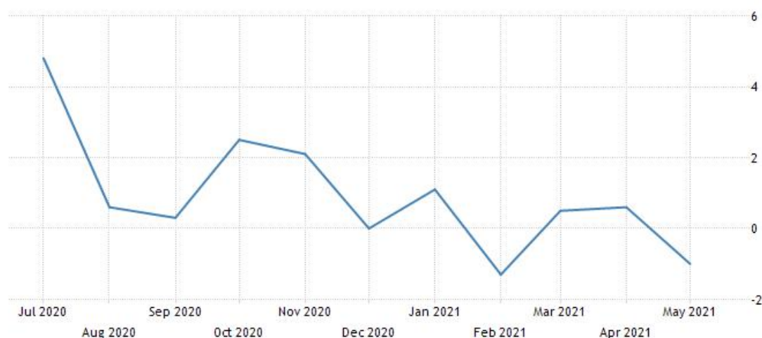
欧元区 5 月工业生产指数

欧元区 5 月工业产出月率意外录得-1%，创 2020 年 5 月以来新低。机构分析欧元区 5 月工业产出数据，由于供应链瓶颈阻碍了活动，欧元区 5 月份工业产值下降。欧盟统计局表示，欧元区工厂、矿山和公用事业 5 月份的产出较上月下降了 1.0%，将 4 月份工业产出环比增幅从首次估计的 0.8% 下调至 0.6%，其中，非耐久消费品产量环比下降 2.3%，能源产量下降 1.9%，资本财产量下降 1.6%，中间财产量下降 0.2%，而耐久消费品产量上升 1.6%。按年率计算，5 月份工业产值增长 20.5%，低于经济学家预测的 22.4%，这一激增的部分原因是由于 2020 年 5 月非常疲弱的数据造成的基数效应，当时许多工厂被勒令关闭，经济在公共卫生危机中几近停顿。