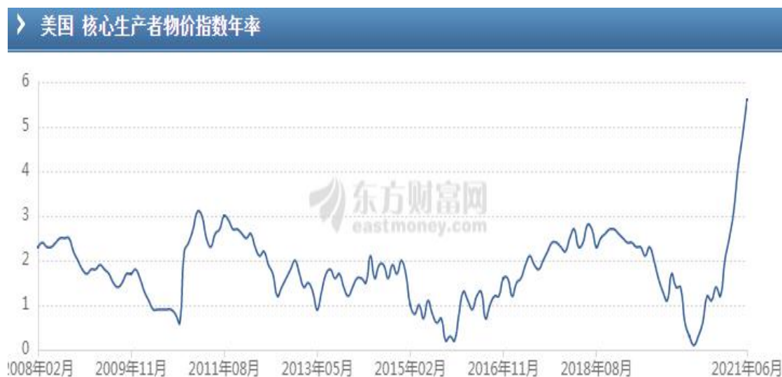
美国核心生产者物价 PPI 指数

美国 6 月 PPI 年率录得 7.3%，美国 6 月核心 PPI 年率录得 5.6%，均创有纪录以来新高。