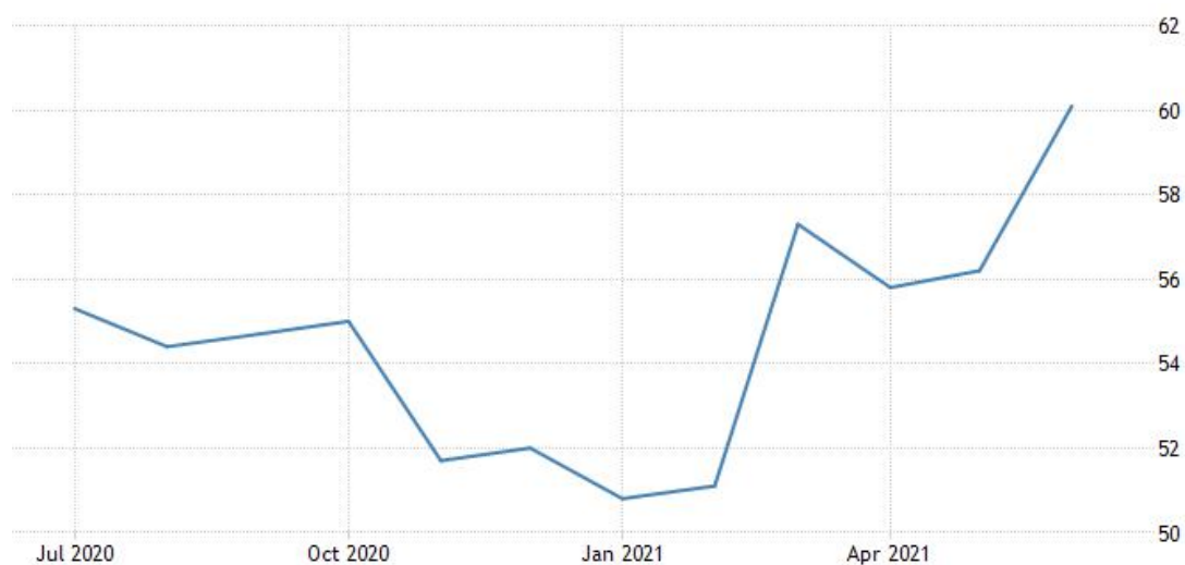
德国综合 PMI 指数

德国 6 月 Markit 综合 PMI 终值为 60.1，预期 60.4，前值 60.4，Markit 服务业 PMI 终值为 57.5，预期 58.1，前值 58.1。IHS Markit 经济学家 Phil Smith 表示 6 月德国与疫情相关的防控措施进一步放宽，服务业商业活动复苏势头强劲。面向客户的服务业务活动有所复苏，整体呈现积极趋势，因为企业和消费者信心的上升，帮助刺激了需求的普遍回升。6 月德国服务业活动激增的同时，制造业生产也出现了更强劲的扩张，这使经济在第二季度走上了稳健增长的轨道，第三季度可能会有更好的表现。然而，在需求强劲反弹的同时，我们看到成本继续飙升，这两个因素共同推动了服务公司收费的上涨，这在过去 20 多年的数据纪录中是前所未有的。