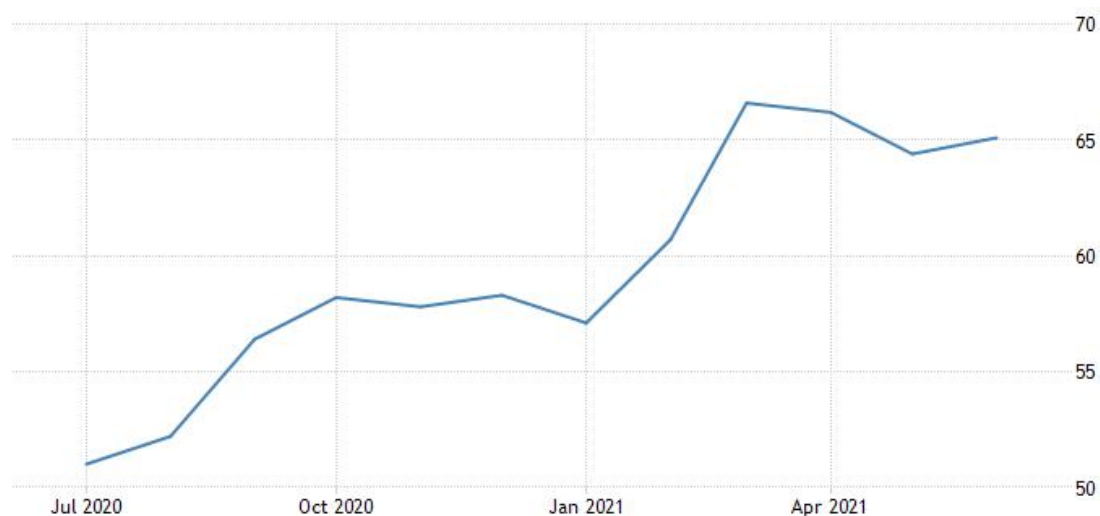
德国制造业 PMI 指数