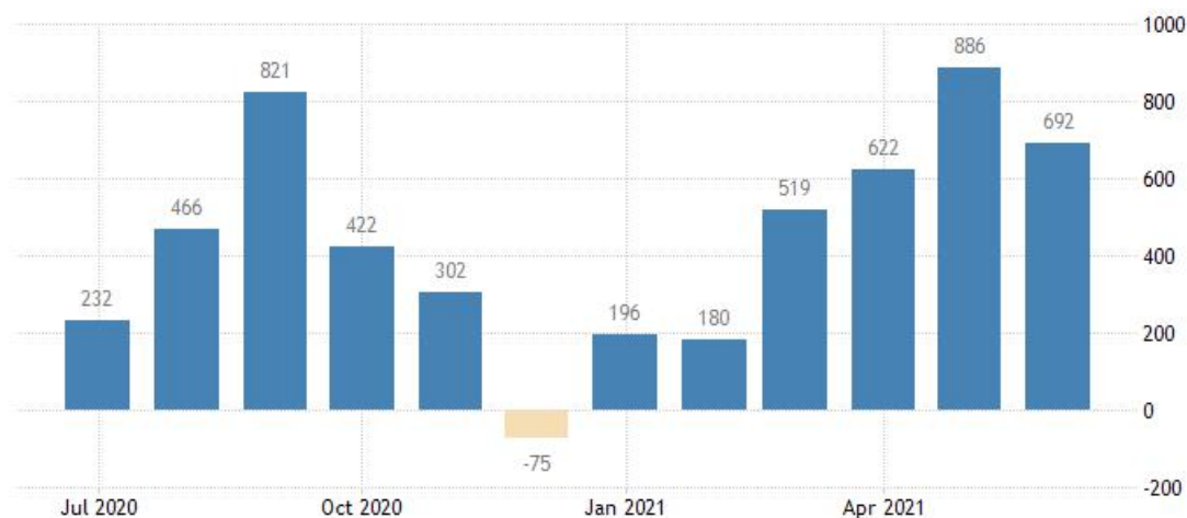
数据来源：全球经济指标数据网

美国上周首次申领失业救济人数为 37.3 万人，预估为 35 万人，前值为 36.4 万人。机构表示初请失业金人数小幅上升，但仍接近疫情爆发以来的低点，因就业市场正逐步全面复苏。尽管人数有所反弹，但由于卫生危机减轻，以及被压抑的需求刺激了酒店和餐馆等企业的招聘，自年初以来，每周初请失业金的人数减少了一半以上。预计，今年第二季度劳动力市场将进一步改善，预计失业率将在第四季度降至 5% 以下。由于超过 1.55 亿美国人已经完全接种了新冠疫苗，以及限制措施的取消，推动了商业的快速重启。