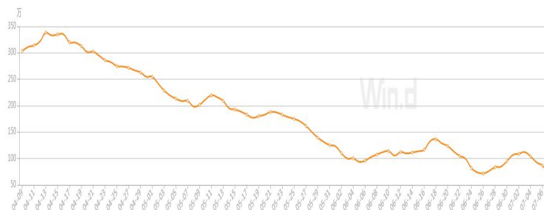
美国每日疫苗接种速度明显放缓