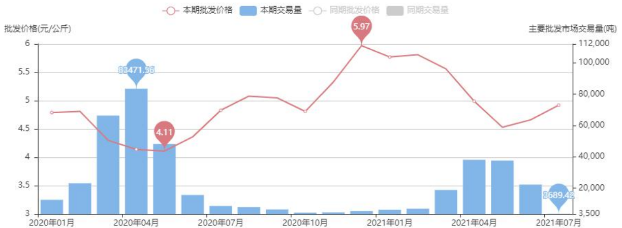
图7 菠萝批发平均价