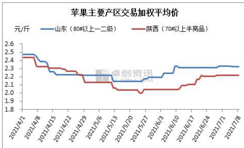
图2 苹果主要产区交易加权平均价

销区：本周（20210702-0708）批发市场苹果价格基本维持稳定，出货速度放缓。今年市场苹果行情稳定性较好，价格变动不大。近期市场苹果价格变动不大，只是货源质量差异较大，价格差异明显。上半周市场出货速度良好，华北等地市场苹果销售良好，主要是因为销区气温不高，走货速度尚可。华南、华东市场出货速度一般。从本周一前后开始，各地高温天气频发，市场苹果销量明显下降。夏季市民消费中以西瓜等解暑水果为主，在气温较高的时间段更加明显。商超方面近段时间市场采购积极性尚可，出货速度相对比较稳定。电商平台采购低价货源，出货情况良好。近段时间电商需求多数为质量比较差货源。