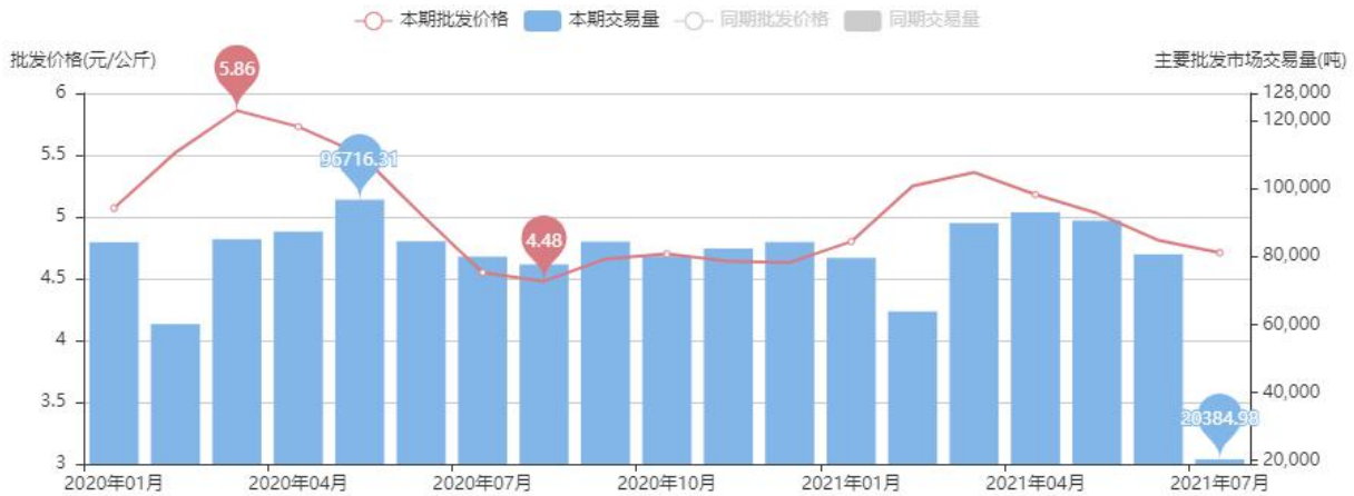
图8 香蕉批发均价