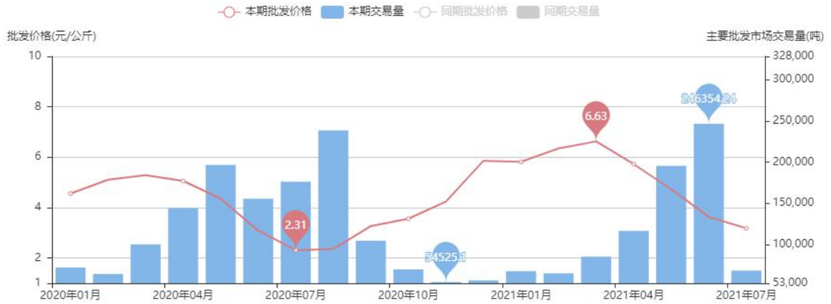
图6 西瓜批发平均价 数据来源 中国农业信息网 和合期货