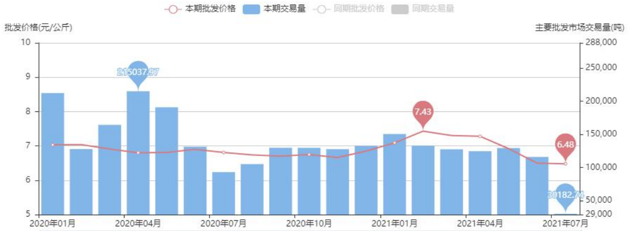
图5 富士苹果批发平均价