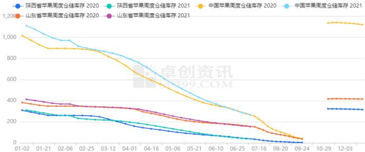
图3 全国苹果库存 (万吨)

据卓创资讯数据显示，截至 7 月 8 日，全国苹果库存为266.69 万吨，高于去年同期的253.24 万吨，分地区来看，山东地区库存为153.86 万吨，略高于去年同期151.56万吨，陕西地区库存为37.396万吨，高于去年同期34.71万吨库存消耗情况来看，7月8日当周全国苹果库存消耗量为22.4万吨，环比略有减少，分地区来看，山东地区库存消耗量为7.43万吨，陕西地区库存消耗量为6.21万吨。