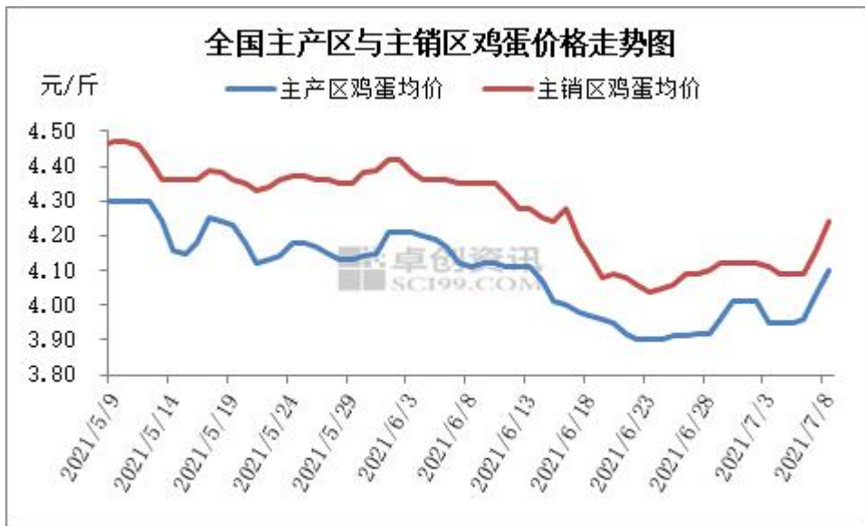
图 2 全国主产区和主销区鸡蛋价格走势