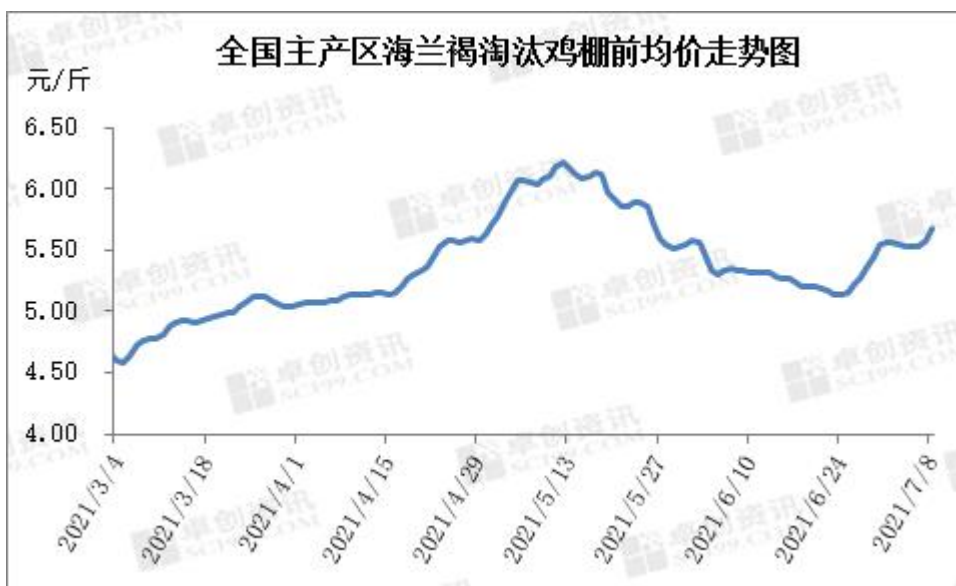
图 4 全国主产区海兰褐淘汰鸡棚前均价走势图

本周主产区淘汰鸡价格微幅下跌后明显上涨，全国日均价由 5.55 元/斤跌至 5.52 元/斤后上涨至 5.68 元/斤；周均价 5.56 元/斤，环比上涨 0.20 元/斤，涨幅 3.73%。本周淘汰鸡供应量仍不多，养殖单位普遍压栏观望，个别积极淘汰产蛋率下降的蛋鸡，供应面继续支撑市场价格。需求方面，屠宰企业开工积极性不高，多按订单屠宰老鸡；农贸市场受高温天气以及替代品价低影响，销量有限。本周后期鸡蛋价格上涨，拉动市场老鸡价格。与周初相比，华北地区涨幅最大，周初均价 5.63 元/斤，周内涨幅 3.78%。