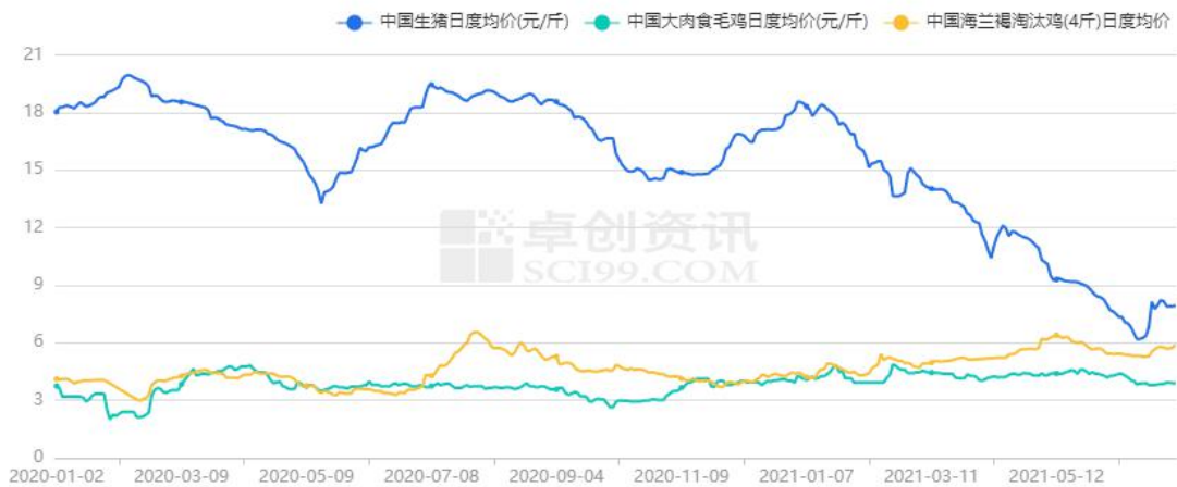
图 6 生猪价格与大肉食毛鸡、淘汰鸡价格对比

从生猪养殖市场来看，本周五全国生猪均价 7.95 元/斤，上周五 8.16 元/斤相比，下跌 2.57%；本周五自繁自养盈利 106.09 元/头，上周五 176.46 元/头，减少 39.88%。猪价大幅跌价后，中小散户出栏积极性不高，北方挺价，再加上发改委发布“中央和地方讲启动猪肉储备收储工作”消息提振，市场博弈加剧，猪价调整频繁，周内期猪价窄幅震荡。