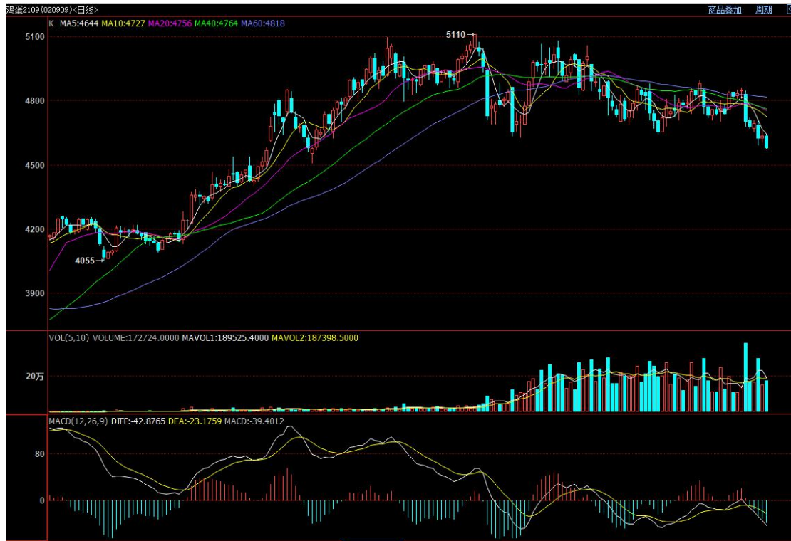
图 1 鸡蛋主力 09 合约走势图

本周鸡蛋主力合约 jd2109 周一到周五震荡下跌，本周五，鸡蛋主力合约 jd2109 收盘价 4582 元/500 千克，较上周五收盘价相比下跌 123 元/500 千克，跌幅为 2.61%。