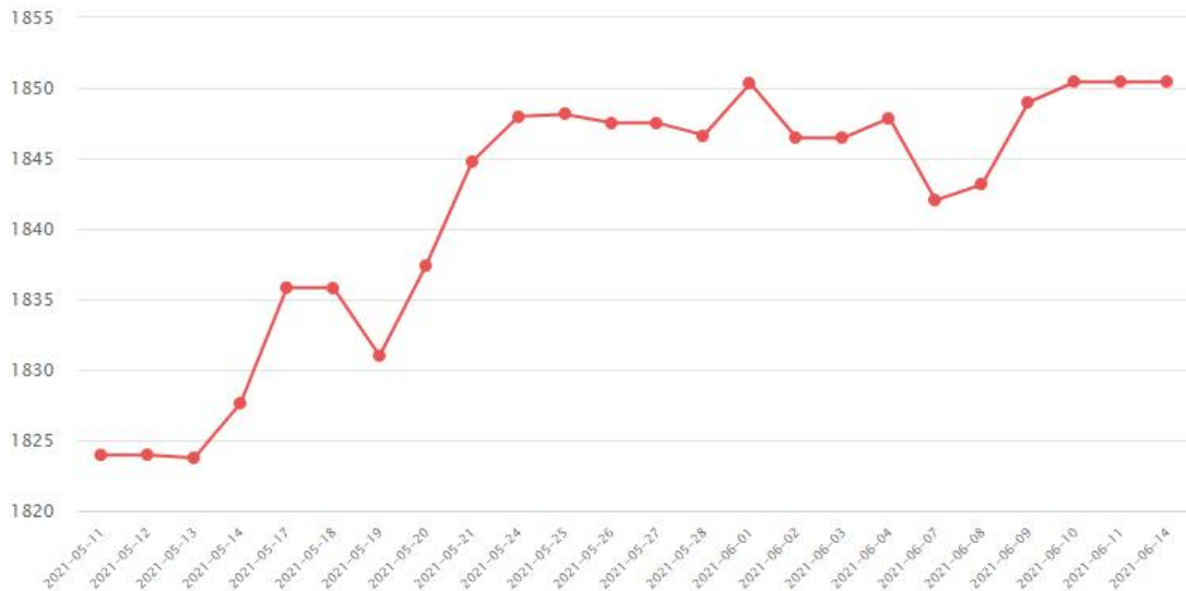
全球主要黄金 ETFs 持仓量（吨）

美国商品期货交易委员会(CFTC)的最新数据显示，由于金价在 1900 美元左右挣扎，对冲基金开始在看涨黄金的押注中获利了结。尽管许多分析师至少在今年年底之前仍看好黄金，但许多分析师表示，在两个月的强劲上涨后，金价在 1900 美元以下盘整将是健康的。CFTC 的交易员报告显示，截至 6 月 8 日当周，基金经理将 Comex 黄金期货的投机性总多头头寸减少 2233 手，至 145037 手。这是六周以来黄金净头寸首次下降。黄金的净头寸目前为 107664 手合约，较前一周下降了 2%。