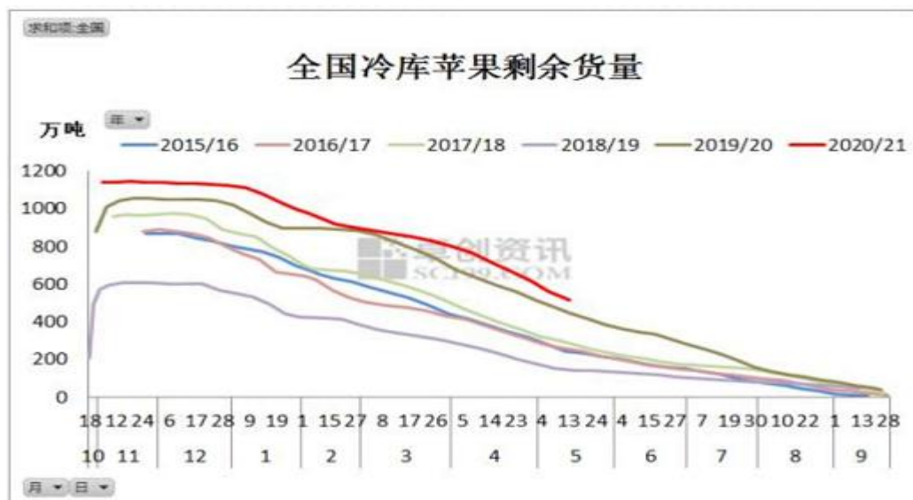
数据来源：卓创资讯、和合期货