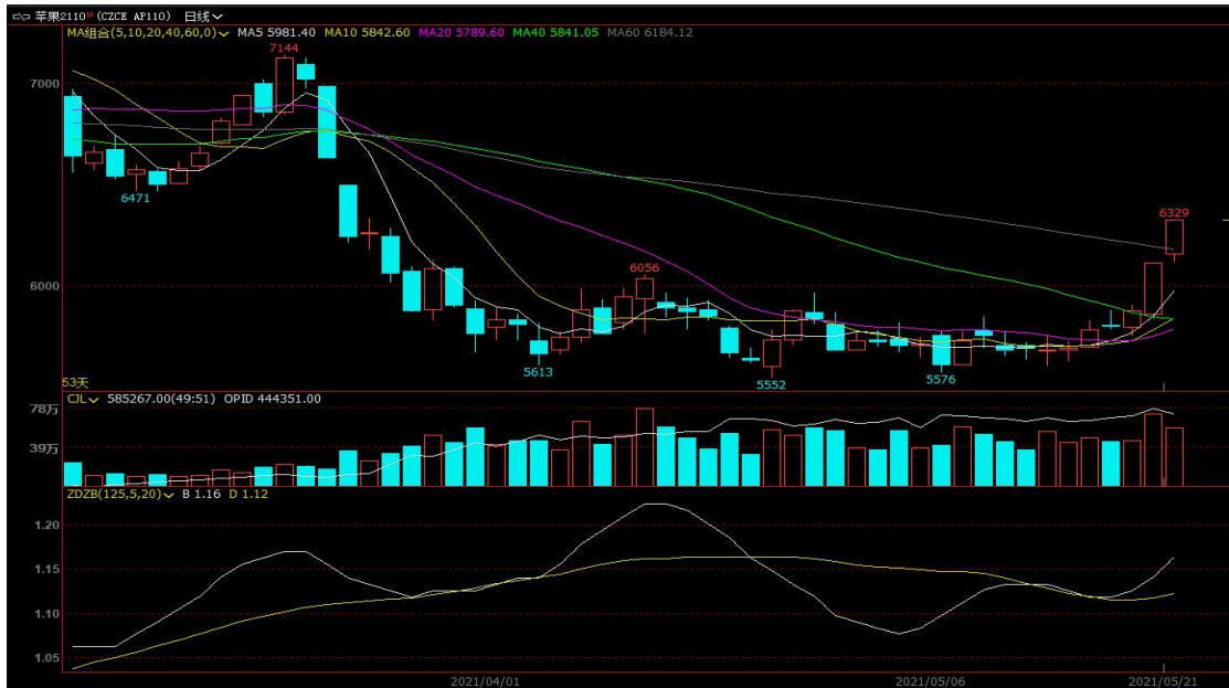
数据来源：文华财经 和合期货