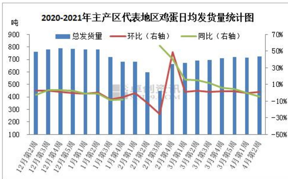
图 3 全国主产区代表地区鸡蛋日均发货量

本周主产区代表市场发货量部分稳定，部分小幅增加，周内市场内销略有加快，产地库存缓慢消化，整体流通情况向好，但外销市场偏弱，销区对高价接受能力一般，蛋价涨至高位后，要货积极性减弱；后市看，近日市场运行相对平稳，各环节多顺势出货，预计下周主产区发货量变动仍不大。