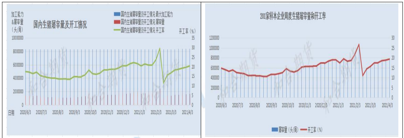
图3 生猪屠宰及开工情况

从全国主要监测屠宰企业的屠宰量及开工率来看，环比上周继续增加。截止4月7日，全国主要监测屠宰企业生猪屠宰量为1705549头，较上周增加59974头，增幅3.64%。本周开工率为20.36%，较上周增加0.72%。从201家样本企业周度生猪屠宰量和开工率来看，截止本周4月7日，屠宰量为768548头，较上周增加20928头，增幅2.79%。本周屠宰开工率为19.34%，较上周增加0.53%。