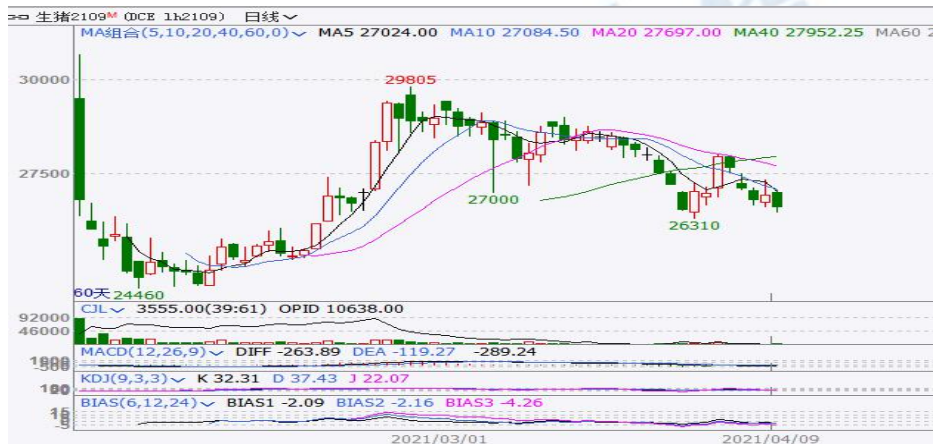
图 2 生猪期货日 K 线图