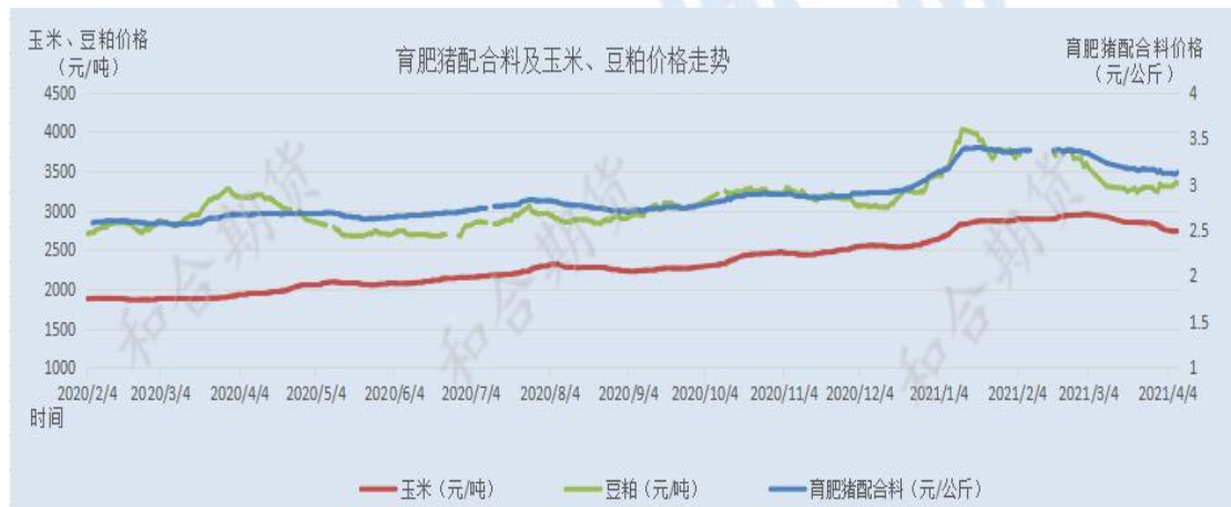
图 4 育肥猪饲料价格与玉米、豆粕价格走势

收购也无量，部分粮送养殖户尚有盈利，南下发货几无利润。截止到4月6日，山东地区玉米净粮上车 1.36-1.42 元/斤，河南地区净粮主流上车价格在 1.40-1.42 元/斤，贸易商年后毛粮收购成本多在 1.38-1.42 元/斤，价格基本跌至前期成本线。4月2日起，山东深加工企业门前玉米到货量急剧下跌，4日之后晨间玉米到车辆基本维持在 100 辆以下，部门厂家门前持续无车，厂家开始试探性回调，近两日山东地区深加工企业玉米主流涨 2 分左右，河南地区价格维持相对稳定。虽然企业价格上涨，但预计难以涨至前期高点，预计山东地区深加工厂家价格或主流涨至 1.42-1.45 元/斤。从这一波落价潮来看，玉米市场涨跌是买卖双方心态的博弈。虽然下游副产品亏损，需求低迷，导致产区玉米价格跌势汹汹，但目前看存粮贸易商仍有底线成本支撑，价格继续下跌较困难。预计本月维持涨跌调整局面，宽幅震荡运行，难有明显趋势性大涨大跌。