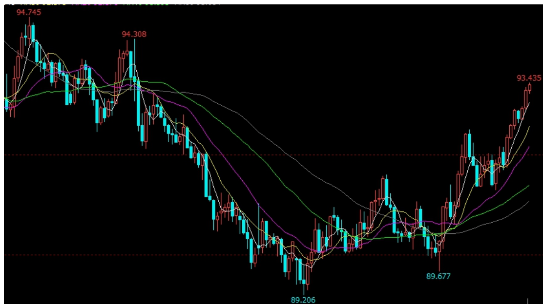
数据来源：文华财经 和合期货

美元强势将在短期内持续，但尚未形成长期趋势，当前推动美元上涨的原因，并不具备长期性。当前美元指数的反弹，主要是疫苗接种所引发的美国经济复苏预期和快速上行的长期美债收益率所引发的资产定价重估，这两个因素都不是长期因素，因而对美元弱势逆转的持谨慎态度，基于美国财政及货币政策刺激将持续，美元中长期将重回下行趋势。