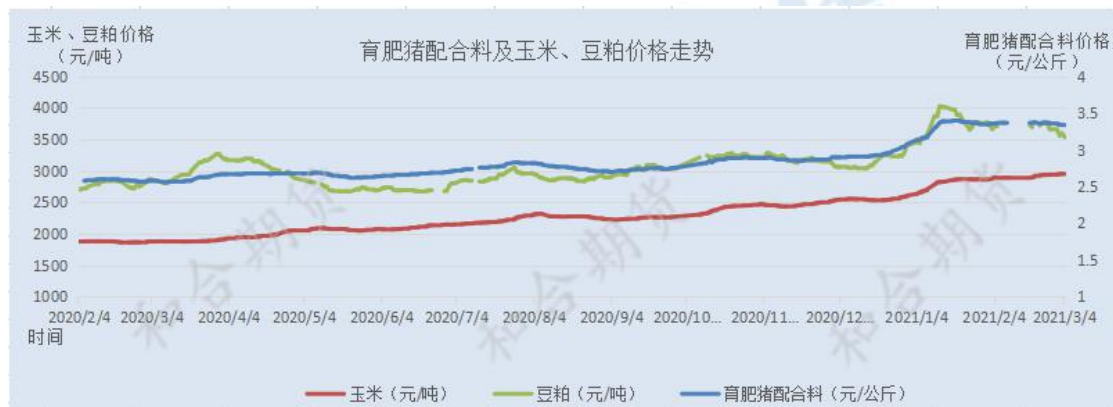
图 5 育肥猪饲料价格与玉米、豆粕价格走势

进口量也在逐年攀升。据悉，2020 年我国粮食进口量到 1.4 亿吨，比 19 年高出 3 千多万吨。玉米进口再创纪录，我国 2021 年玉米进口量 1130 万吨，高出 19 年 135.7%！抢粮大战，不仅发生在国内，更发生在国际上，国与国之间也充满着各种博弈。据悉，截至 2 月 4 日，世界粮食价格已连涨 8 个月，创下 2014 年 7 月以来的新高。特别是玉米的价格，仅在 1 月就暴涨了 11.2%，同比增长 42.3%；同时，世界各种粮食的库存量，也下降到 5 年来的最低水平。我国对玉米的需求远大于供给，并且更愿意屯粮，不愿意售卖，这样就倒逼企业涨价。国内的玉米价格和国际市场上的玉米价格，都在持续上涨。各国或因天气干旱问题，或因产量不高，或因库存骤降，或因减少出口，导致玉米总体供应量较为紧张，捉襟见肘。供不应求的紧张局面短期内难以扭转。