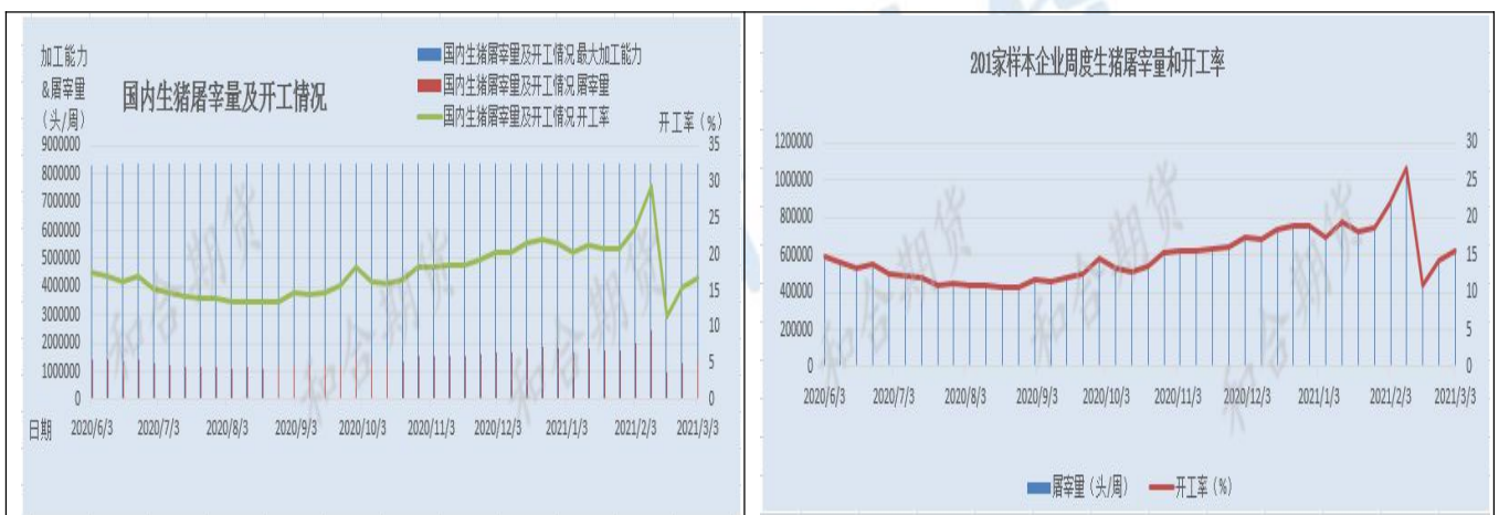
图 4 生猪屠宰及开工情况

从全国主要监测屠宰企业的屠宰量及开工率来看，环比上周继续增加，但尚未恢复至年前水平。截止 3 月 3 日，全国主要监测屠宰企业生猪屠宰量为 1400589 头，较上周增加 100670 头，增幅 7.74%。本周开工率为 16.75%，较上周增加 1.2%。从 201 家样本企业周度生猪屠宰量和开工率来看，截止本周 3 月 3 日，屠宰量为 621480 头，较上周增加 50578 头，增幅 8.86%。本周屠宰开工率为 15.64%，较上周增加 1.28%。