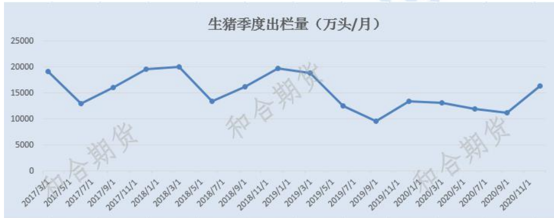
图 2 生猪季度出栏情况

交割月生猪供应对应春节后 3、4 月仔猪出栏，当前能繁母猪存栏受损严重，仔猪出栏量下降，9-11 月生猪出栏受损基本已成定局，供应端的非预期受损不容忽视，或将成为生猪期价后市上涨的主因之一。