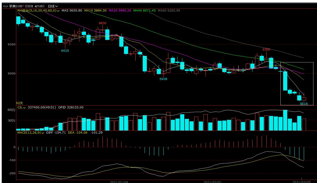
图4 主力合约 AP105 行情走势

周五苹果期货主力 2105 合约盘面下跌调整，收盘价 5585，较上一交易日 -0.25%；成交量 337400 手；持仓 328153 手，-27642 手（单边计算）。