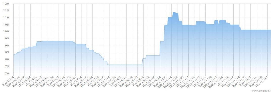
图 2 产区苹果（红富士）价格指数