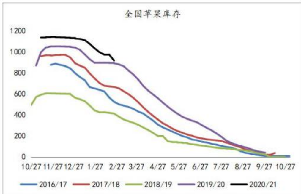
图 5：全国苹果库存（万吨）

据卓创资讯数据显示，截止 2 月 25 日，苹果库存剩余量在 898.27 万吨左右。