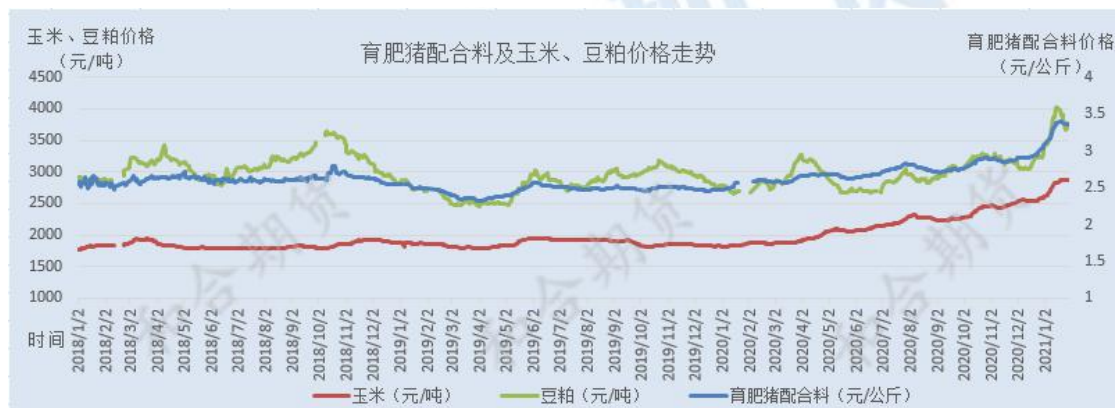
图5 育肥猪饲料价格与玉米、豆粕价格走势

传导至饲料价格，却屡创新高 生猪养殖成本压力再度提升。截止1月28日，育肥猪配合料价格涨至3.36元/公斤，环比12月底上涨0.28元/公斤，涨幅9.1%。饲料持续高位，继续对猪价形成支撑。