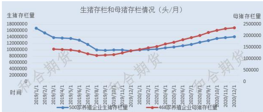
图 2 全国 500 家生猪存栏和 468 家母猪存量情况