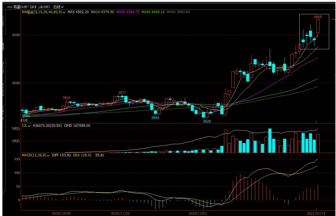
图 2 主力合约 jd2105 行情走势