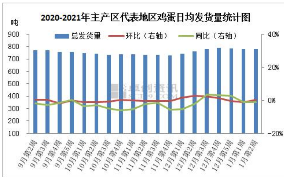
图 3 全国主产区代表地区鸡蛋日均发货量

本周主产区代表市场发货量变动不大，多数维持稳定；受公共卫生事件影响，局部市场流通受阻，加之前期老鸡加速淘汰，多地货源稍显紧缺；周内各环节惜售情绪增强，但终端消化相对平稳，随用随采为主；后市看，终端对市场高价略显抵触，备货相对谨慎，短期市场或以消化存货为主。