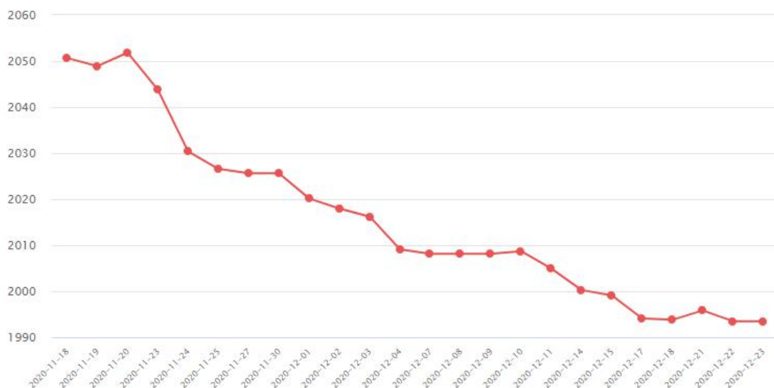
全球主要黄金 ETF 持仓总量

近期随着金价回落，SPDR 黄金 ETF（GLD）在 11 月减持了差不多 61 吨后，12 月至今已经减持了 24 吨。