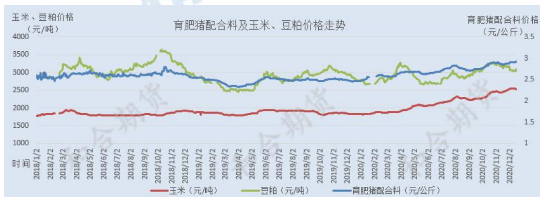
图4 育肥猪饲料价格与玉米、豆粕价格走势

另一方面，需求依然旺盛。据饲料工业协会统计，2020年11月我国饲料总产量2232万吨，环比下降6.3%，同比增长12.8%；1—11月饲料总产量22870万吨，同比增长9.5%。其中11月猪饲料产量932万吨，与上月基本持平，同比增长53.1%，连续6个月同比增长。今年前11个月猪饲料累计产量已经达到2017年和2018年同期的81%，尤其是母猪饲料同比增长78.9%，连续10个月同比增长且增幅较大，直观反映了生猪养殖恢复正在提速。值得注意的是，随着生猪养殖和猪肉消费的快速恢复，蛋禽和肉禽养殖出现了回落，蛋禽和肉禽饲料产量分别为270万吨和753万吨，同比分别下降6.7%和8.4%，环比分别下降5.1%和7.7%，需要保持关注。深加工方面，春节前本就是传统消费旺季，目前企业盈利尚可，行业开机率不断攀升，淀粉企业开机率已经回升至73.6%，超过去年同期水平。深加工消费旺季来临，饲料企业采购积极，预计春季前玉米消费依然旺盛。