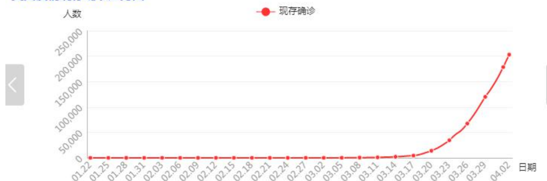
美国疫情现存确诊趋势图

例2373例。其中，纽约市累计确诊病例近52000例。纽约州州长库莫周二表示，该州的